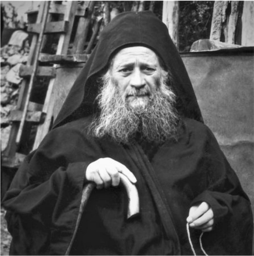
Όσιος Ιωσήφ ο Ησυχαστής (1898-1959).

Οι άνθρωποι του κόσμου αγαπούν τον κόσμο, επειδή δεν γνώρισαν ακόμη την πικρία του.