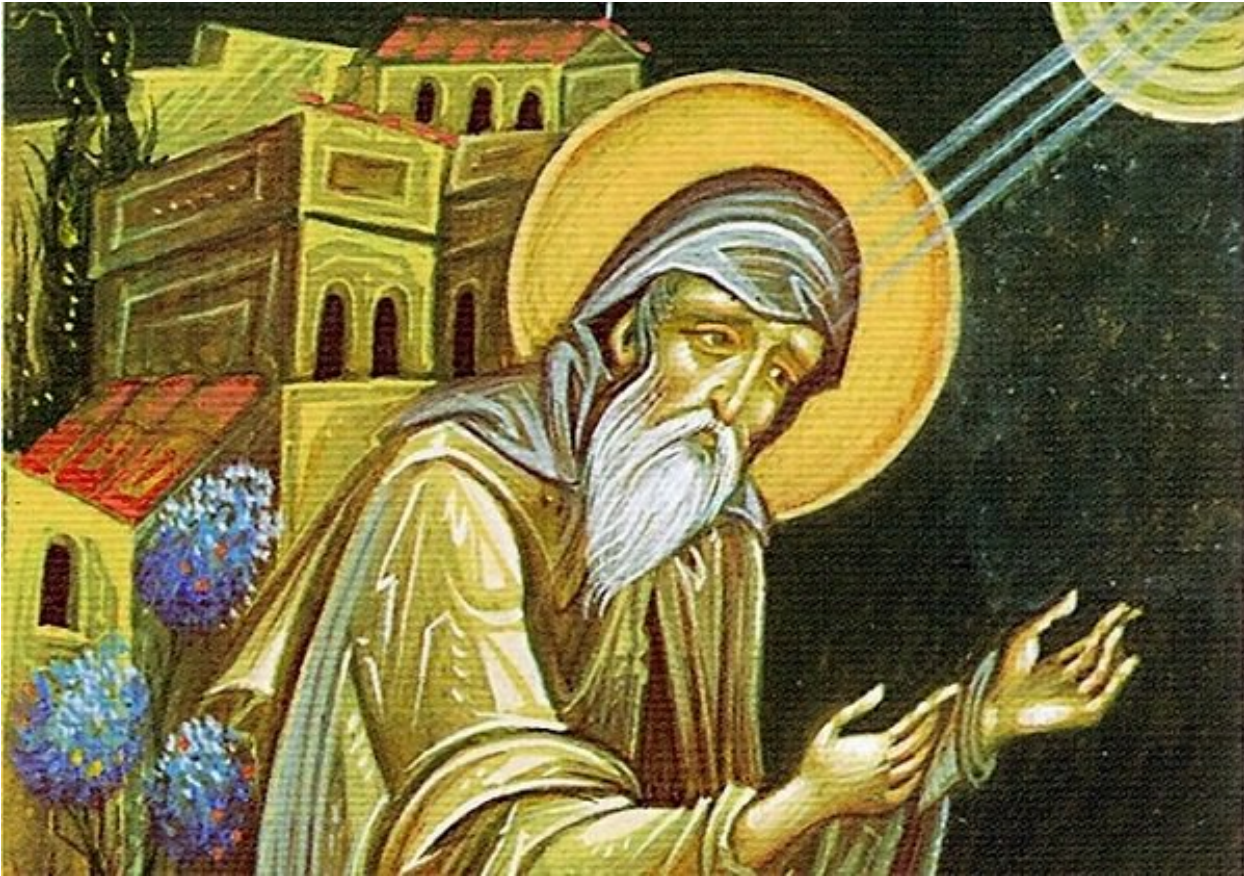
Άγιος Συμεών Νέος Θεολόγος.

Συνέχεια από εδώ: http://www.diakonima.gr/?p=492749