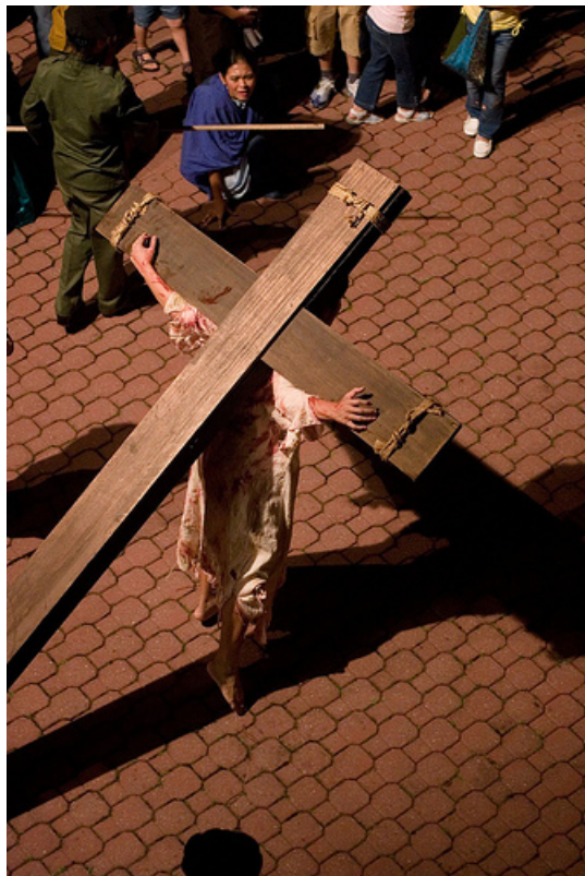
Ομιλία του Αγίου Ιουστίνου Πόποβιτς.

«Όστις θέλει οπίσω μου ακολουθείν, απαρνησάσθω εαυτόν και αράτω τον σταυρόν αυτού, και ακολουθείτω μοι» (Μαρκ. 8, 34).