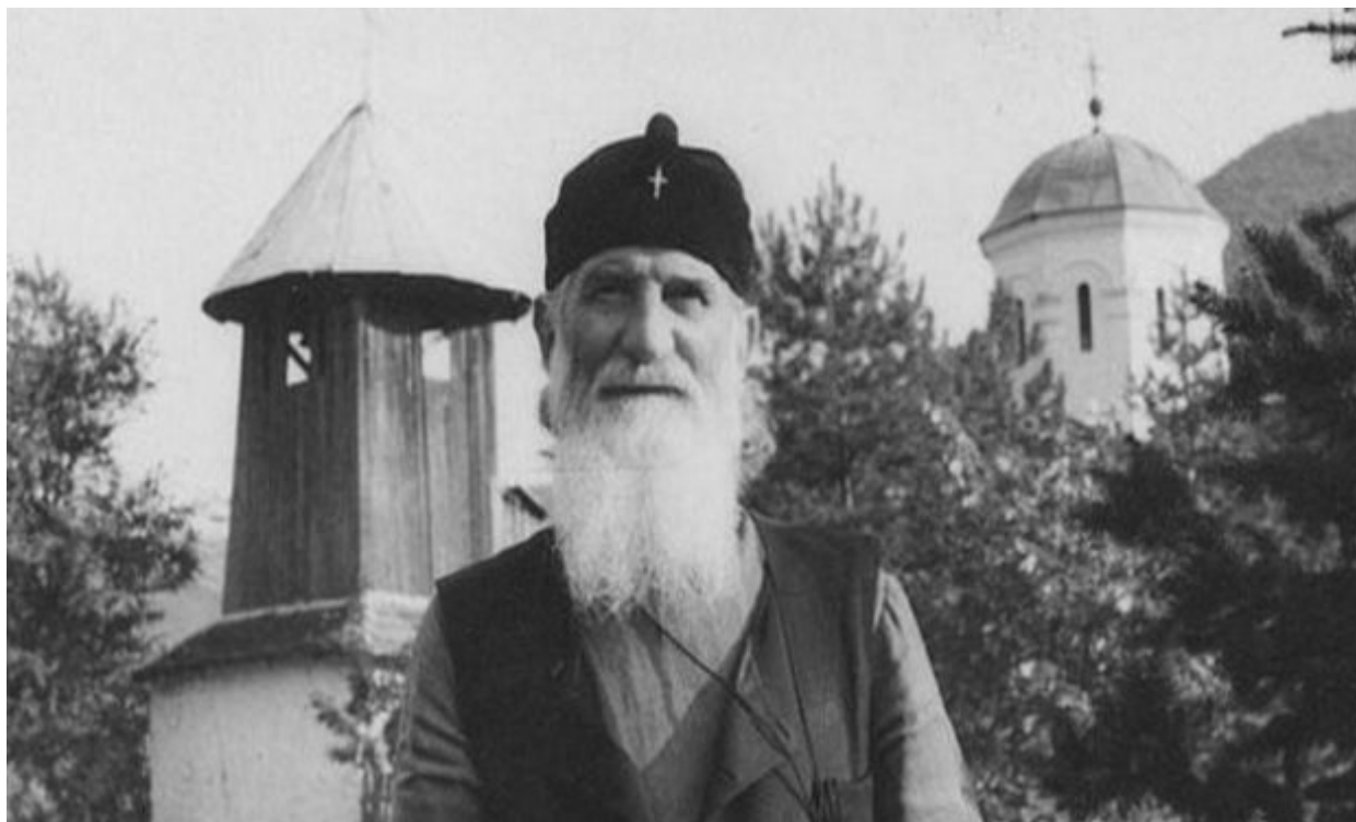
Όσιος Ιουστίνος Πόποβιτς (1894-1979).

Η σωτηρία έγκειται εις τον αγιασμόν του ανθρώπου διά του Αγίου Πνεύματος. Αυτή είναι ένας δύσκολος και μακροχρόνιος αγών (rod vig) διά τον χαρισματικόν εξαγιασμόν, ο οποίος επιτυγχάνεται διά της εργασίας των ευαγγελικών εντολών· ένας αγών προσωπικός, εσωτερικός και ακατάπαυστος.