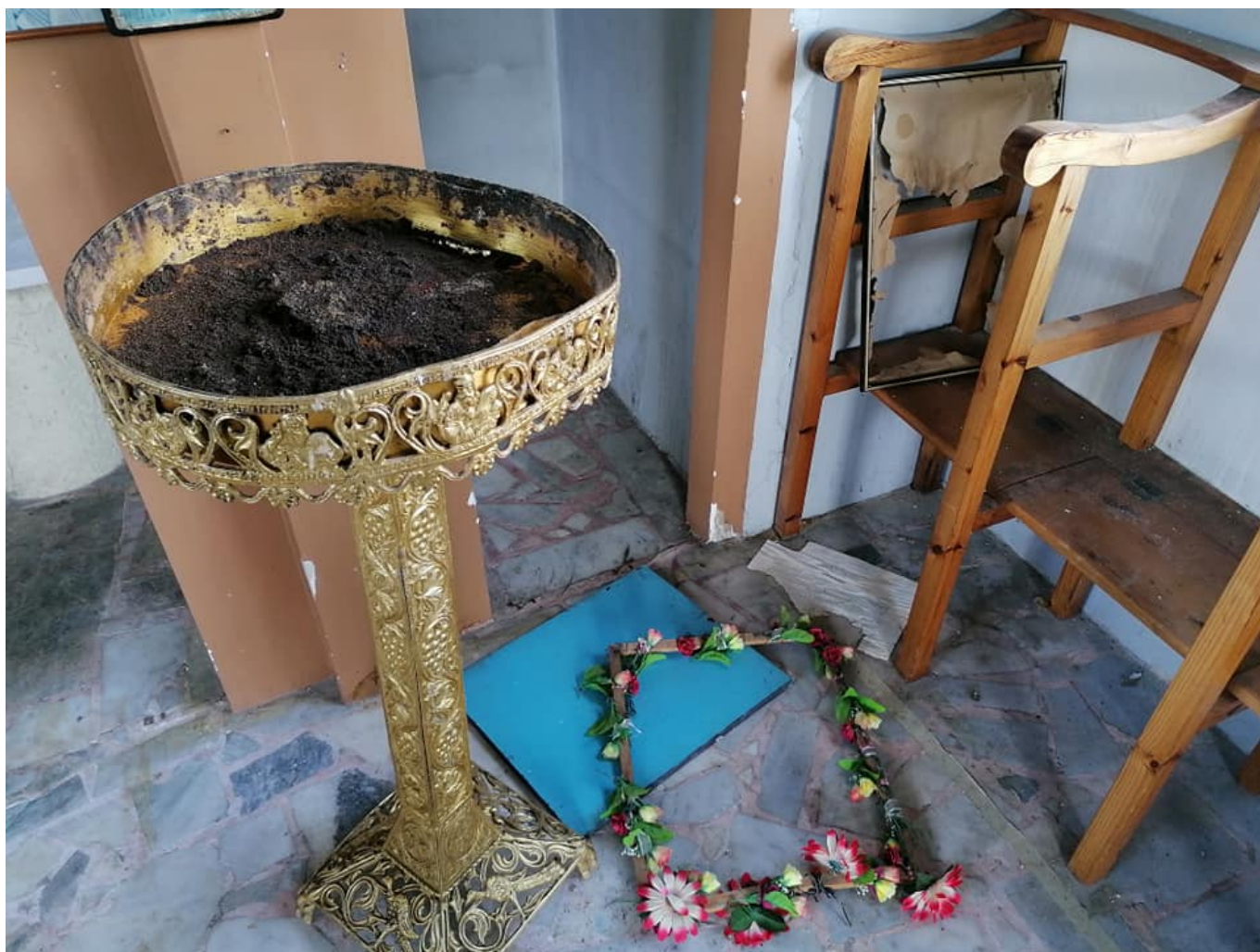
Ο Άγιος Ραφαήλ σήμερα στη Μόρια με θρυμματισμένη την ξύλινη πόρτα και ζημιές στο εσωτερικό.