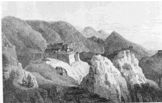
Η επίθεση του Αλή εξαπολύθηκε στις 20 Ιουλίου 1792 και παρά τη σφοδρότητά της, δεν άργησε να καταλήξει σε πανωλεθρία.

Το άλλοτε περήφανο «λιοντάρι της Ηπείρου» αναγκάστηκε να συρθεί σε διαπραγματεύσεις για συνθήκη ειρήνης.