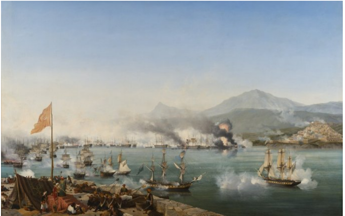
Η ναυμαχία του Ναβαρίνου (1827)- Ελαιογραφία του Γκαρνερέ

Την ουσιαστική λήξη του Αγώνα και το πρώτο λίκνο του πρώτου Ελλαδικού Κράτους εσήμανε το 1827 η Ναυμαχία του Ναβαρίνου την οποίαν ο Πρωθυπουργός τής - συμπρωταγωνίστριας, ωστόσο - Αγγλίας χαρακτήρισε επίσημα «ατύχημα».