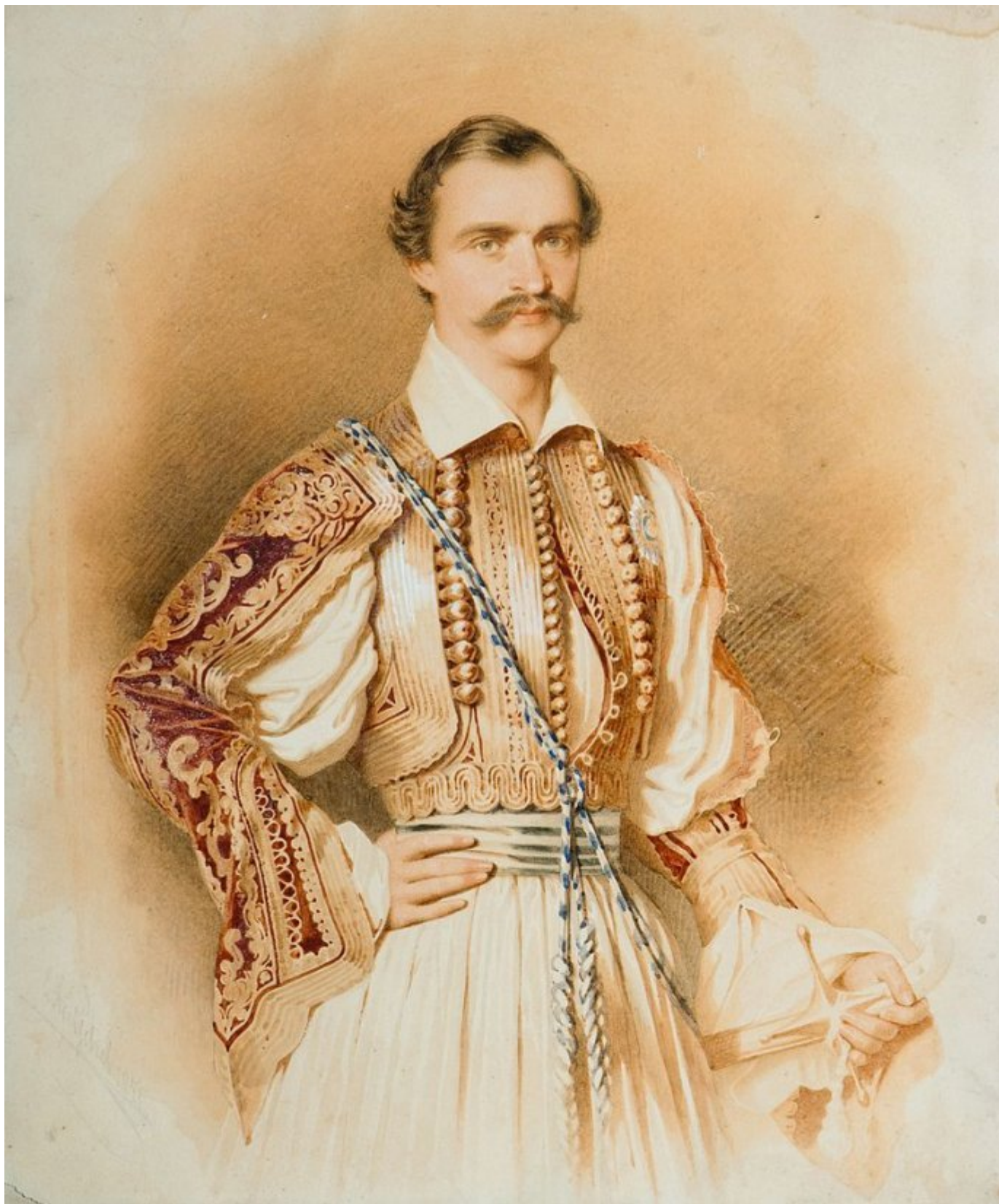
Ο Βασιλιάς Όθωνας με παραδοσιακή ελληνική ενδυμασία.

Το πάθημα δεν γίνεται μάθημα. Εξήντα χρόνια μετά τον Κριμαϊκό ξεσπάει ο Α΄ Παγκόσμιος Πόλεμος. Γαλλία και Αγγλία συγκρούονται με τις Αυτοκρατορίες των Γερμανών και των Οθωμανών και τη Βουλγαρία. Ο Βασιλεύς Κωνσταντίνος επιμένει στην ουδετερότητα, ο Ελ. Βενιζέλος στην έξοδο με τους Δυτικούς. Γαλλία