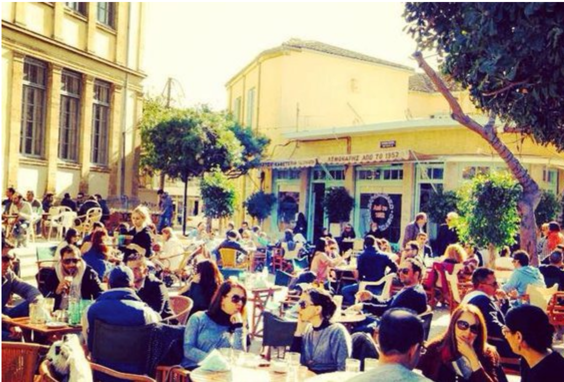
Διαχρονική αξία η Πλατεία Φανερωμένης (φώτο από 2014)

Το στόρι: Πριν από το 1974 αυτή η πλατεία ήταν το κέντρο της πόλης. Έκτοτε, τη θέση της πήρε η Πλατεία Ελευθερίας. Στην περιοχή λειτουργούσε το Παρθεναγωγείο Φανερωμένης, το οποίο ιδρύθηκε από τον Αρχιεπίσκοπο Μακάριο Α΄ το 1857 και ήταν το πρώτο σχολείο θηλέων στην Κύπρο σε μια προσπάθεια να καταπολεμηθεί ο αναλφαβητισμός.