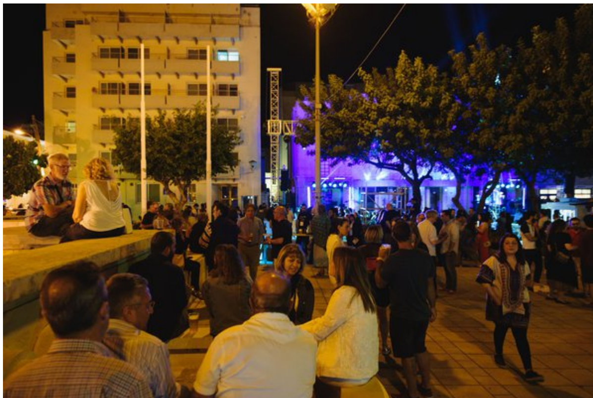
Από εκδήλωση του Ριάλτο, τον περασμένο Μάιο

Vibe: Γύρω από την Πλατεία έχει μπαρ και ταβέρνες, οπότε κατά τους καλοκαιρινούς μήνες ή άμα έχει κάποιο φεστιβάλ το Ριάλτο, το vibe εδώ είναι απίστευτο! Η Λεμεσός στα καλύτερά της!