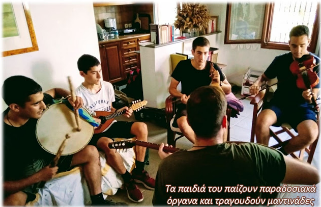
Τα παιδιά του παίζουν παραδοσιακά όργανα και τραγουδούν μαντινάδες

Πού να τα πω και πώς να τα πράξω εγώ αυτά σαν θεολόγος; Κι όμως αυτή η γιαγιά τα έπραττε.