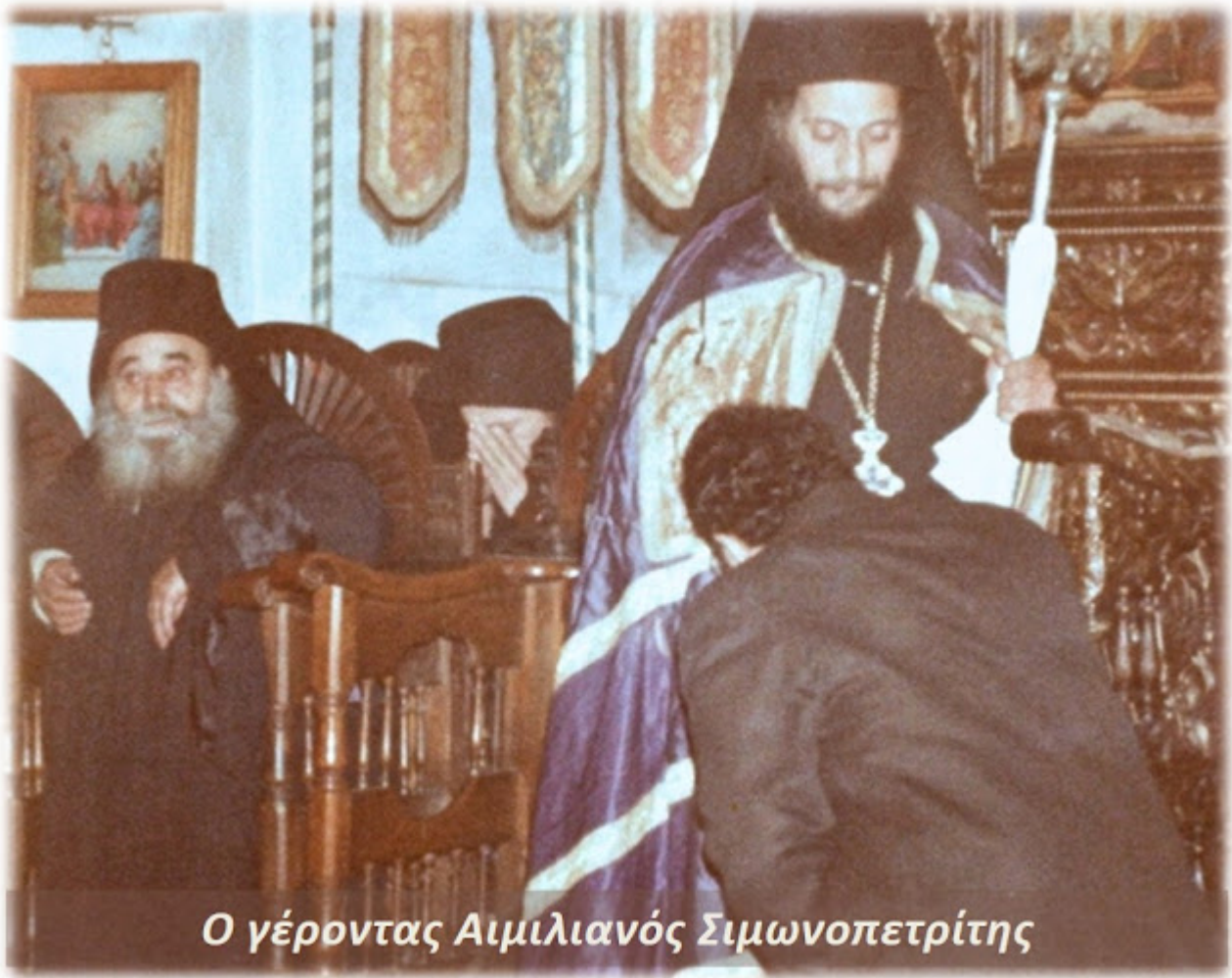
Ο γέροντας Αιμιλιανός Σιμωνοπετρίτης

Ο Θεός περιμένει μόνο να τον αναζητήσεις. Να αφήσεις την οικογένειά σου, την βολή σου, τις δουλειές σου και τις διασκεδάσεις σου, την γυναικούλα σου, τα παιδιά και τα εγγόνια σου και να πας στην Ουρανούπολη και από κει στον ουρανό και λίγο παρακάτω στο Άγιον Όρος. Αυτή είναι η καλή προαίρεση που λένε οι άγιοι πατέρες της εκκλησίας μας και άσε τον Θεό μετά να σε υποδεχτεί σαν στοργικός πατέρας και φιλόξενος νοικοκύρης.