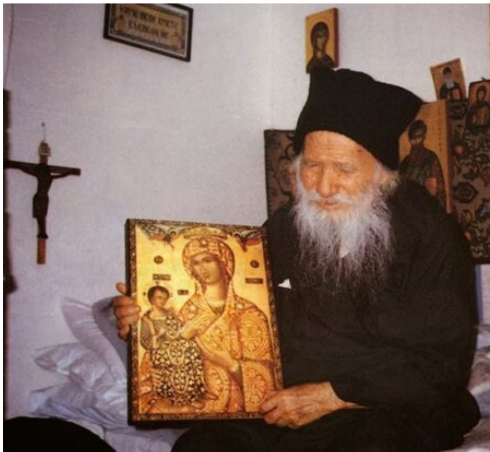
Όσιος Πορφύριος (1906-1991).

Ήρθε στο Μοναστήρι μας [ Ι.Μ. Παντοκράτορος-Ταύ ] ένα πρωί μία μαυροφόρα κι έκλαιγε γοερά: