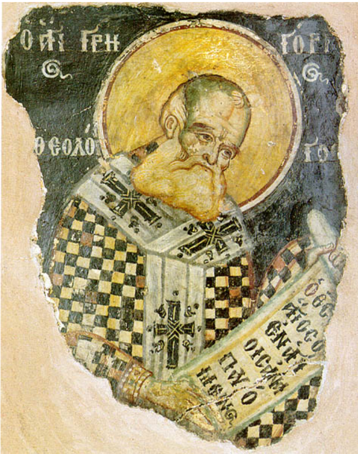
Άγιος Γρηγόριος Θεολόγος.

Απεστάλη μεν, αλλά ως άνθρωπος (επειδή ήταν διπλούς στη φύση), επειδή και ένωσε κούραση και πείνασε και δίψασε και δάκρυσε κατά τους φυσικούς νόμους. Εάν δε εστάλη και ως Θεός, τι σε ενοχλεί αυτό;