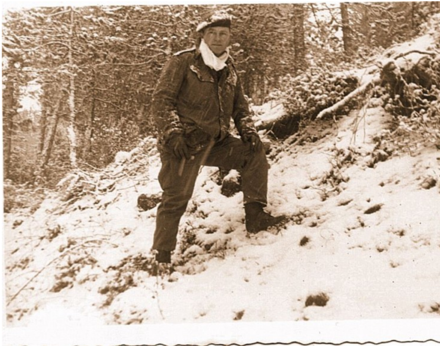
Στα κυπριακά βουνά, Δεκέμβριος 1966