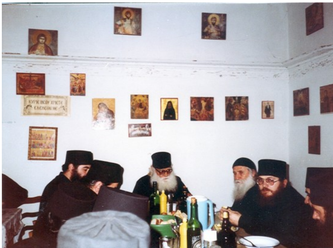
Ο Άγιος Εφραίμ με τον πνευματικό αδελφό του Γέροντα Ιωσήφ και με τα πνευματικά του ανίσια (όπως έλεγε) στη Νέα Σκήτη.

Το έκζεμα το οποίο έχω, αυτήν τη πληγή που έχω στο ποδάρι, το 'χω από δεκαπέντε χρόνων. Δοκίμασα διάφορα φάρμακα, τίποτε. Τώρα που πέρασε η ηλικία, περισσότερο επιδεινώθηκε το πράγμα. Καθήμενος στο κρεβάτι, το ονομάζω το κρεβάτι του πόνου, εγώ. Διότι να καθίσω όπως καθόσατε εσείς, δεν μπορώ. Θα καθίσω λίγο, δεν μπορώ, κατεβαίνουν τα αίματα και πονάει περισσότερο η πληγή, ενώ έτσι, τρόπον τινά, αν βάλεις κι ένα μαξιλάρι έτσι και σηκώνεις λιγάκι το ποδάρι πιο ψηλά, κατεβαίνουν κάτω τα αίματα και ελαφρώνεται ο πόνος. Ε, τη νύχτα προσπαθώ έτσι να ελαφρώσω τον πόνο.