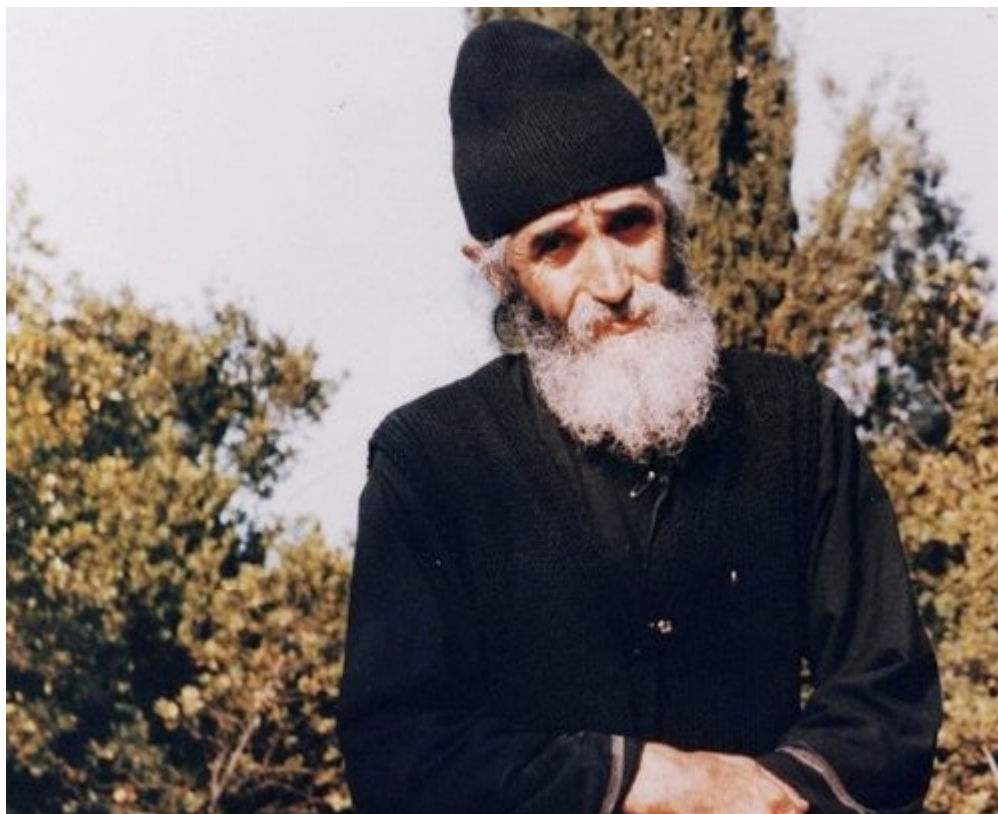
Όσιος Παΐσιος Αγιορείτης (1924-1994).

- Γέροντα, τι βοηθάει να διώχνω τους λογισμούς υπόνοιας;