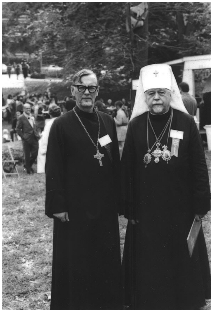
Archpriest Alexander Schmemmann & Metropolitan Ireney

Η Σωφροσύνη ! Αν δεν περιορίσουμε- πράγμα που συχνά πολύ λαθεμένα γίνεται- την έννοια της λέξης «σωφροσύνη» μόνο στη σαρκική σημασία της θα μπορούσε να γίνει κατανοητή σαν το θετικό αντίστοιχο της λέξης “αργία”. «Αργία», πρώτα απ’ όλα, είναι η αδράνεια, τὸ σπάσιμο της διορατικότητας και της ενεργητικότητάς μας, η ανικανότητα να βλέπουμε καθολικά, σφαιρικά. Επομένως αυτή η ολότητα είναι το εντελώς αντίθετο από την αδράνεια. Αν συνηθίζουμε με τη λέξη σωφροσύνη να εννοούμε την αρετή την αντίθετη από τη σαρκική διαφθορά, είναι γιατί ο διχασμένος χαρακτήρας μας, πουθενά αλλού δεν φαίνεται καλύτερα παρά στη σαρκική επιθυμία, που είναι αλλοτρίωση του σώματος από τη ζωή και τον έλεγχο του πνεύματος. Ο Χριστός επαναφέρει την «ολότητα» (τη σωφροσύνη) μέσα μας και το κάνει αυτό αποκαθιστώντας την αληθινή κλίμακα των αξιών, με το να μας οδηγεί πίσω στο Θεό.