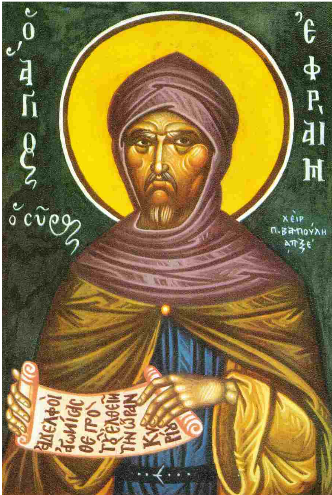
Άγιος Εφραίμ ο Σύρος

έλλειψη ενδιαφέροντος, φροντίδας και σεβασμού. Και είναι ακριβώς η «αργία», μαζί με τη «λιποψυχία» που απευθύνονται αυτή τη φορά προς τους άλλους· έτσι συμπληρώνεται η πνευματική αυτοκτονία με την πνευματική δολοφονία.