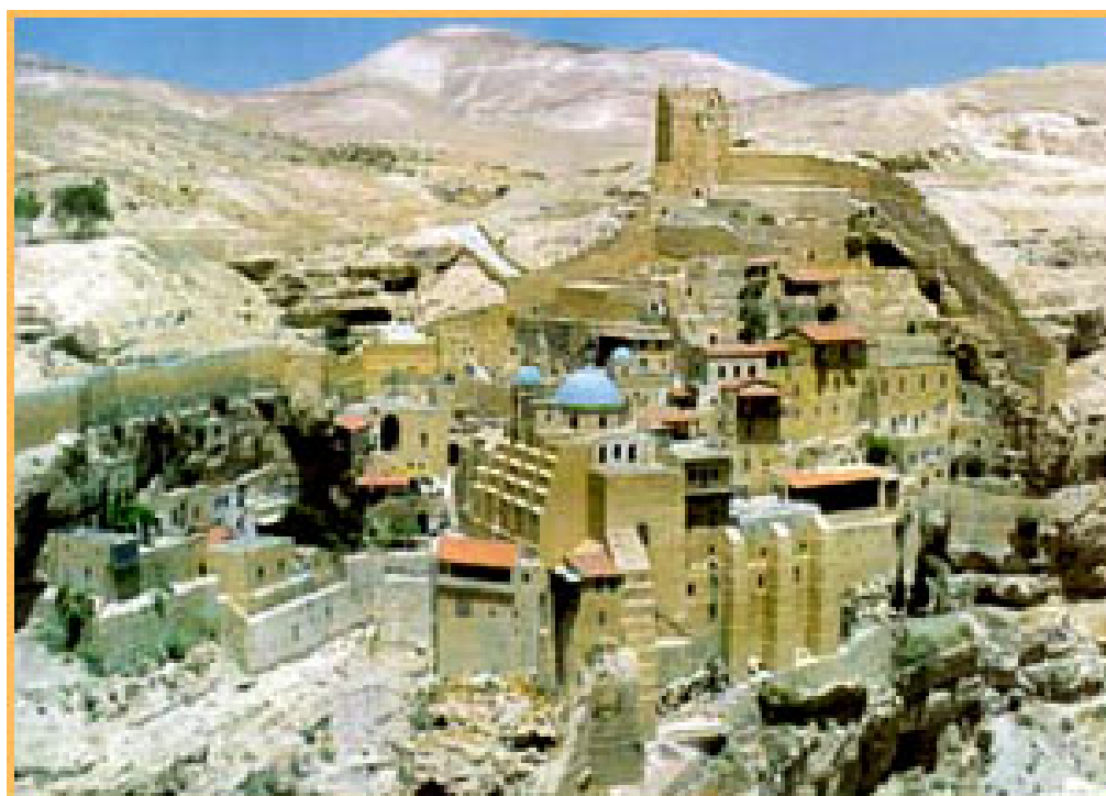
Μονή Αγ.Σάββα στην Ιουδαία