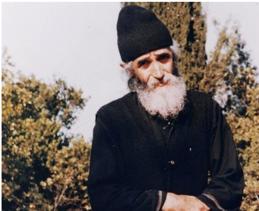
Άγιος Παΐσιος Αγιορείτης (1924-1994).