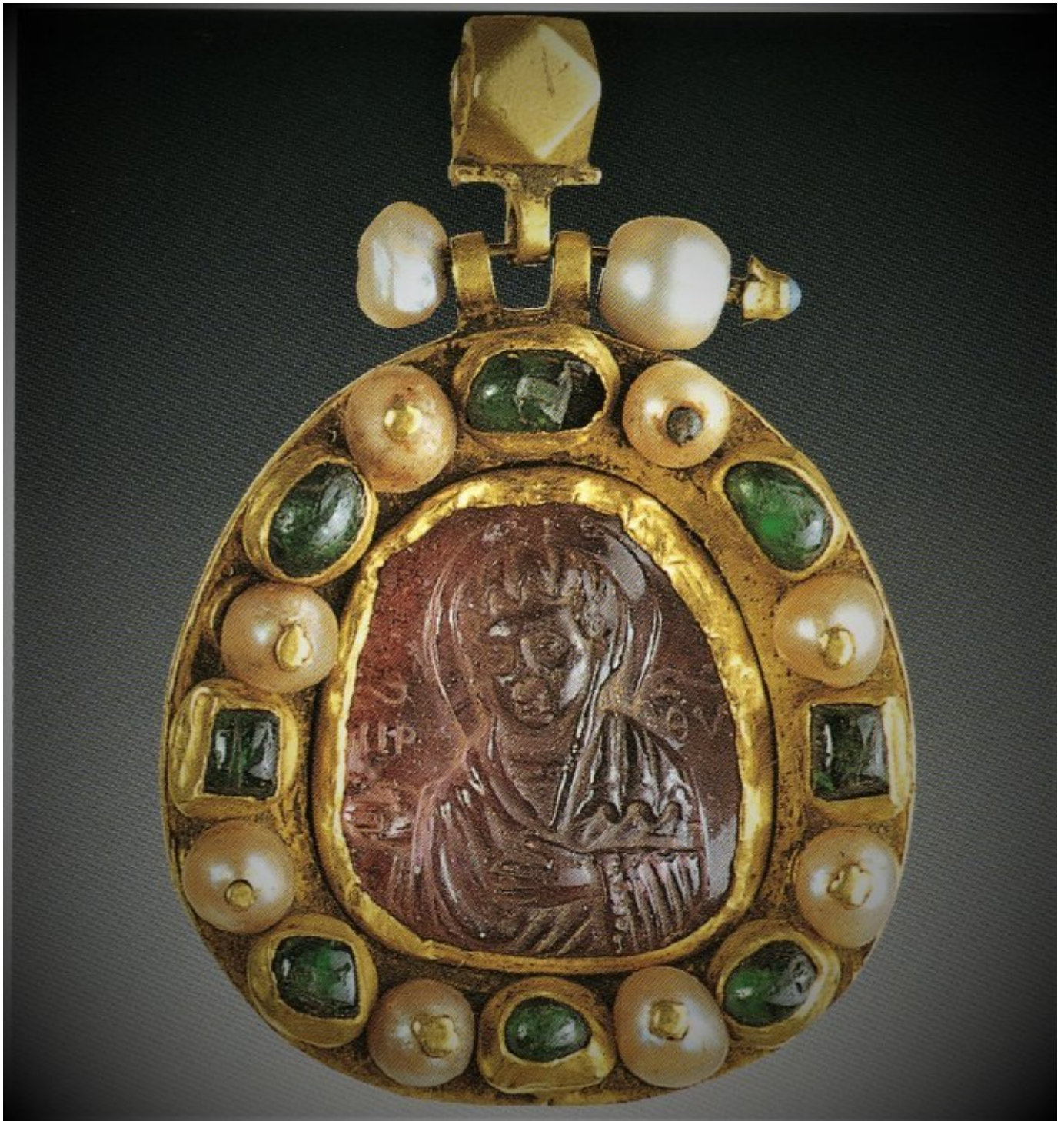
Εγκόλπιο με διάλιθο πλαίσιο. Η Παναγία σε προτομή με στάση δεήσεως (12ος-13ος αι.) Ι.Μ. Βατοπαιδίου

Οι δομές του Κόμβου -θα υπάρχουν 17 κατηγορίες- και τα αποτελέσματα θα είναι πολυγλωσσικά, ευνοώντας με αυτό τον τρόπο τη διείσδυση της ορθόδοξης πνευματικότητας και του πολιτισμού σε λαούς που δεν είναι γλωσσικά ικανοί να διαβάσουν την ελληνική γλώσσα. Και μια ιδιαίτερα σημαντική λεπτομέρεια: Η πρόσβαση και η χρήση του υλικού θα είναι ελεύθερες, καθώς το πρόγραμμα χρηματοδοτήθηκε από ευρωπαϊκούς πόρους.