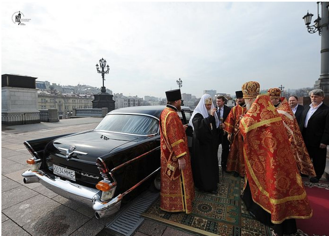
Η Τσάϊκα (ΣτΜ: ρωσικής κατασκευής αυτοκίνητο) τού Μητροπολίτη Νικοδήμου (Ροτόφ) είναι πιο πρόσφατο μοντέλο από το αυτοκίνητο στο οποίο γίνεται αναφορά στην συνέχεια. Πριν από μερικά χρόνια, επιδιορθώθηκε για χρήση στην συνοδεία των αυτοκινήτων τού Πατριάρχη για επίσημες εκδηλώσεις. Στη φωτογραφία: άφιξη τού Πατριάρχη Κυρίλλου στον Μέγα Εσπερινό τού Πάσχα στον Καθεδρικό Ναό του Χριστού Σωτήρος, 15 Απριλίου 2012.

Για το πώς συνάντησαν στελέχη τής Komsomol τον νέο Μητροπολίτη Λένινγκραντ και Νόβγκοροντ Νικόδημο, αφηγείται ο Μητροπολίτης Σμολένσκ και Καλινινγκράντ Κύριλλος και νυν Παναγιώτατος Πατριάρχης, στη συλλογή “Άνθρωπος τής Εκκλησίας”: