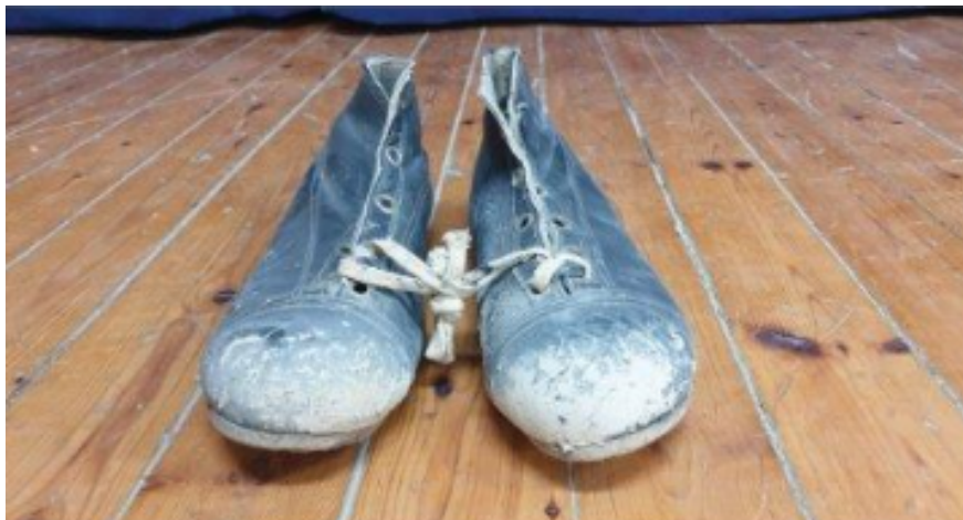
Τα ποδοσφαιρικά παπούτσια του ήρωα Χαράλαμπου Μούσκου.

καταστατικό και τον Σύλλογο ή και να μην ανανεώσουν την άδεια λειτουργίας του. Όμως, η έναρξη του Β' Παγκοσμίου Πολέμου ανάγκασε τους Βρετανούς να αλλάξουν τακτική. Καλούσαν και τους κατοίκους Λυθροδόντα να καταταχθούν στον βρετανικό στρατό και να πολεμήσουν κατά του Άξονα.