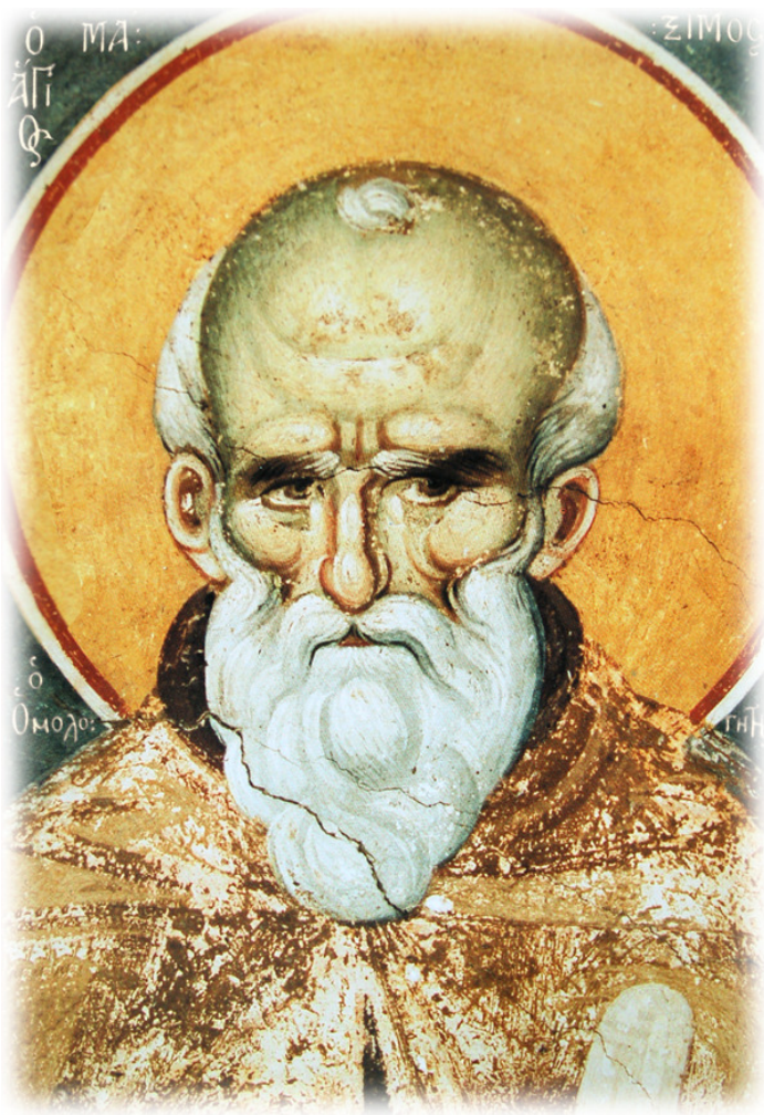
Άγιος Μάξιμος Ομολογητής.