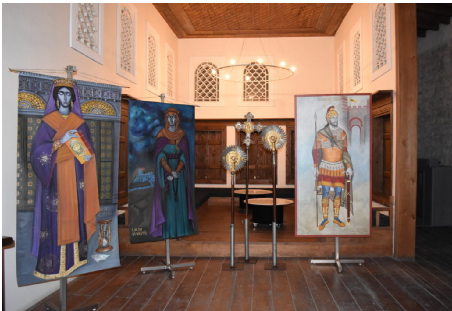
Από αριστερά διακρίνονται οι πίνακες: Άννα Πορφυρογέννητη Κομνηνή (1083-1153), Ελένη Παλαιολόγου Δραγάση (1371-1459) και Κωνσταντίνος ο ΙΑ Παλαιολόγος- Δραγάσης.