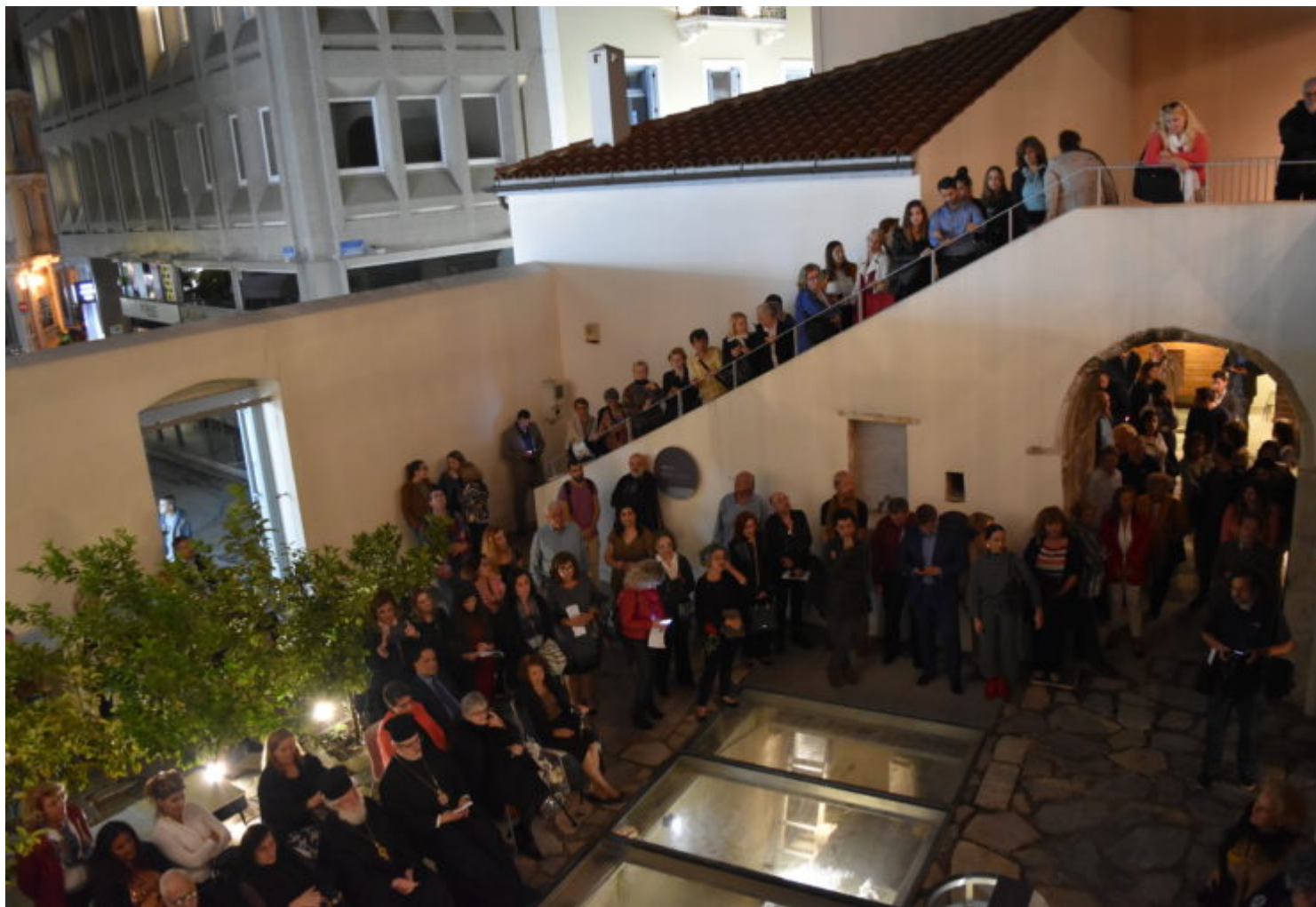
Στιγμιότυπο από την έκθεση ζωγραφικής «Αθανασία».