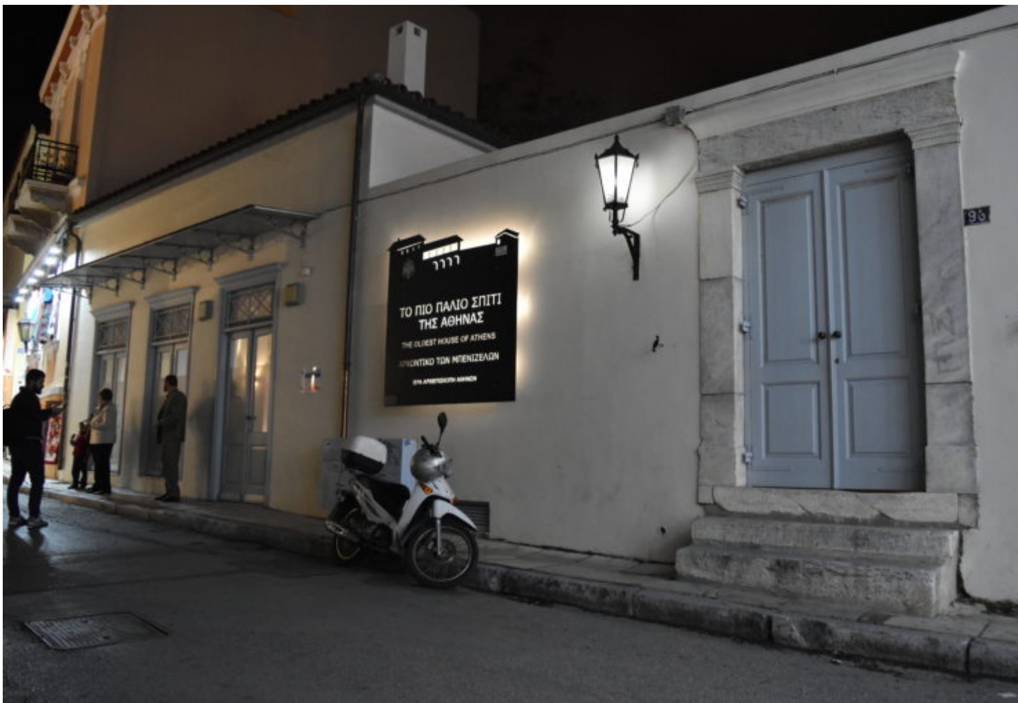
Το Αρχοντικό των Μπενιζέλων (Σπίτι της Αγίας Φιλοθέης) στην Πλάκα.

Στην παρούσα έκθεση τα πρόσωπα είναι γνωστά, μιας και η ιστορία τα θυμάται μέσα από την πορεία τους και τα χνάρια που άφησαν ορατά για πάντα στις επερχόμενες γενιές. «Διαλέξαμε συμβολικά μερικά πράγματα από το περιβάλλον μέσα στο οποίο έζησαν αυτοί οι άνθρωποι, ανάλογα με την ροπή, την τάση τους και με το τι θέλαν να κάνουν στη ζωή τους» λέει η κα Φίλη για τα έργα.