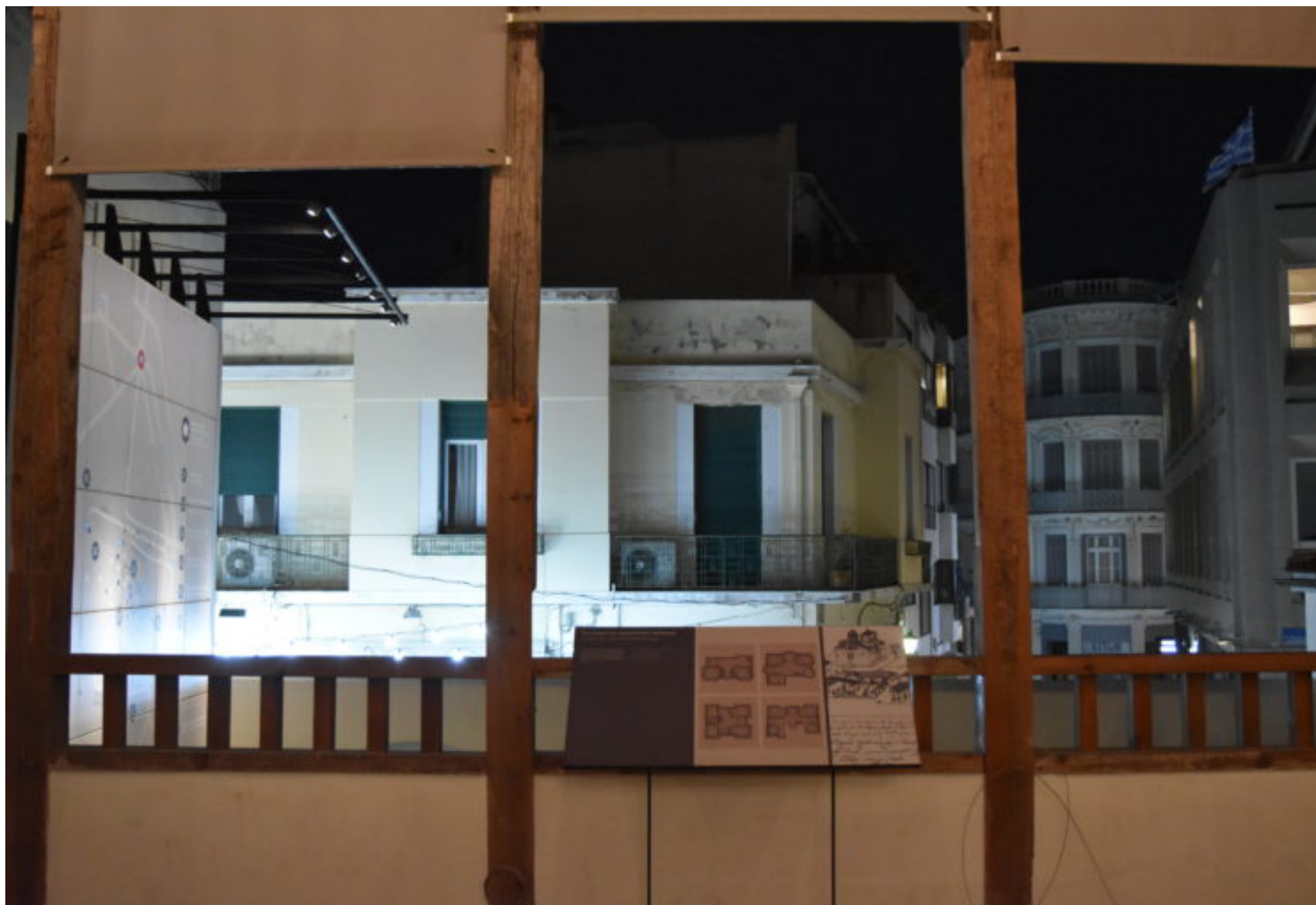
Το Αρχοντικό των Μπενιζέλων (Σπίτι της Αγίας Φιλοθέης) στην Πλάκα.