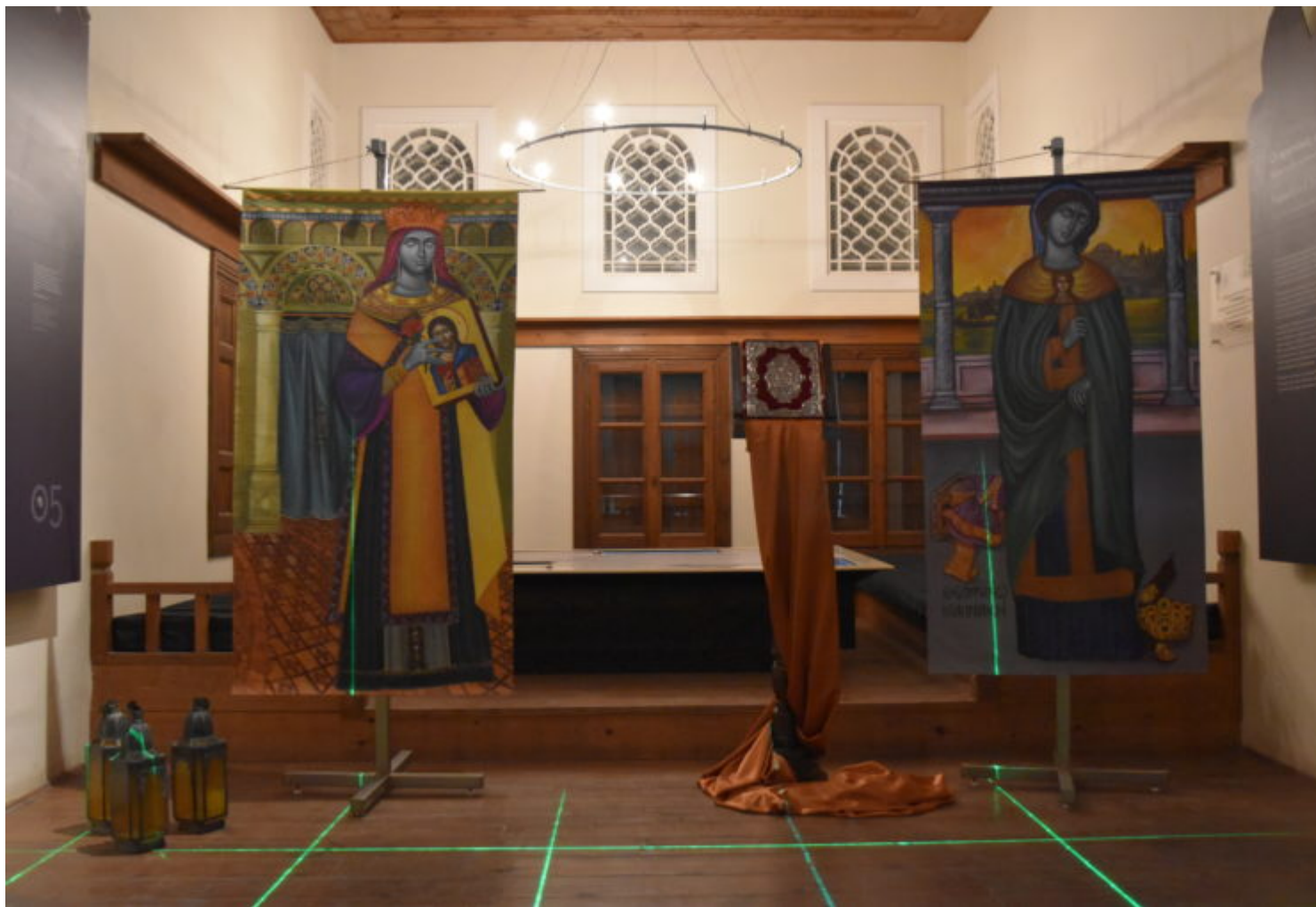
Στιγμιότυπο από την έκθεση ζωγραφικής «Αθανασία».

Ανάμεσα στα «γνώριμα πρόσωπα», όπως τα χαρακτήρισε η κα Φίλη, συναντάμε αυτά της Θεοδώρας Ιουστινιανού, της Ελένης της Κωνσταντινούπολης, της Αγίας Θεοδώρας, της Αννας Πορφυρογέννητης Κομνηνής, αλλά και των δύο Κωνσταντίνων, του Α' και του Ι'Α του Παλαιολόγου.