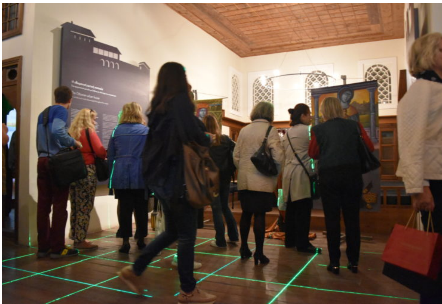
Στιγμιότυπο από την έκθεση ζωγραφικής «Αθανασία».