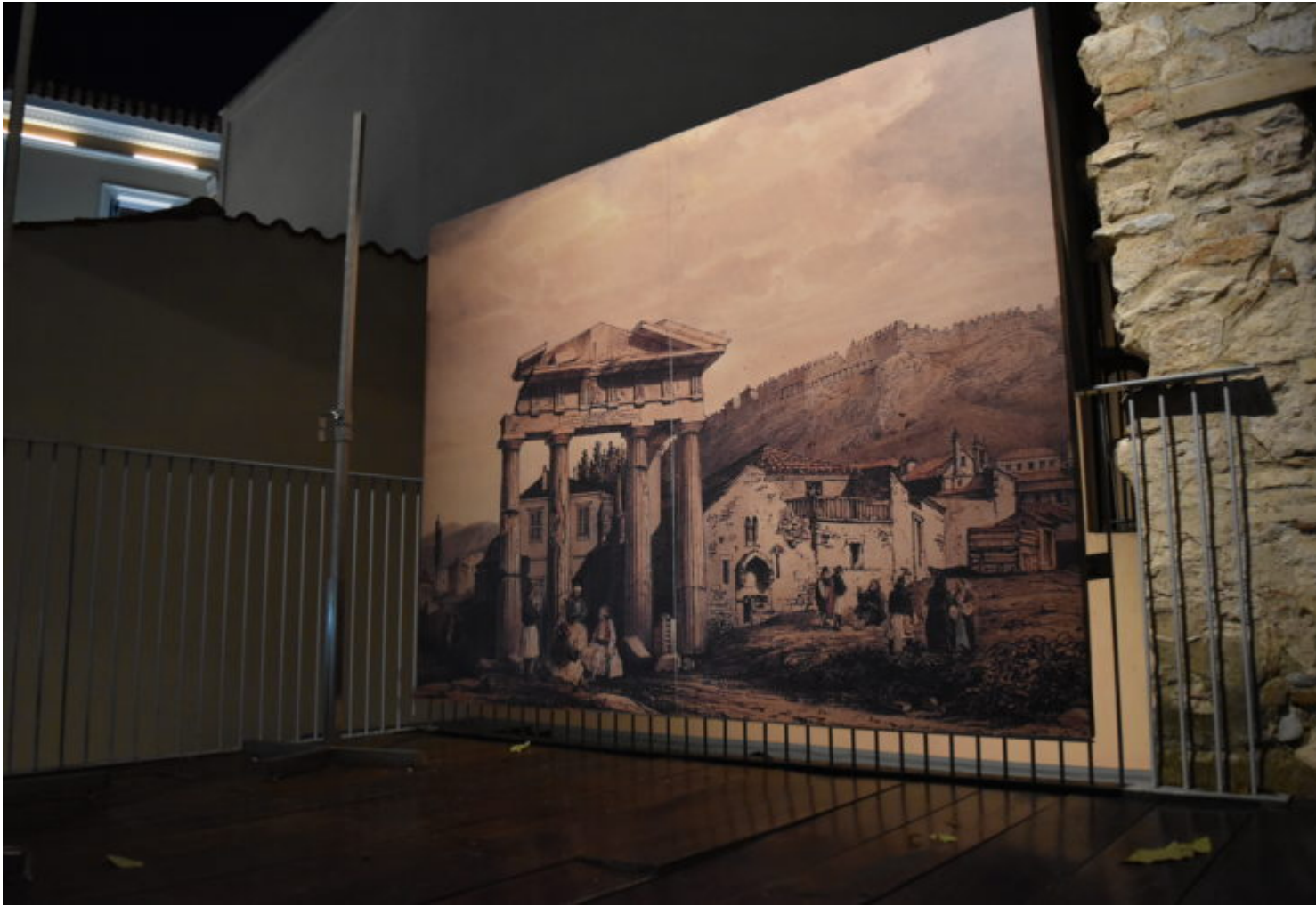
Το Αρχοντικό των Μπενιζέλων (Σπίτι της Αγίας Φιλοθέης) στην Πλάκα. Φωτογραφία: «Εθνικός Κήρυξ»/ Αναστάσιος Κουτσογιάννης

Στιγμιότυπο από την έκθεση ζωγραφικής «Αθανασία». Φωτογραφία: «Εθνικός Κήρυξ»/ Αναστάσιος Κουτσογιάννης