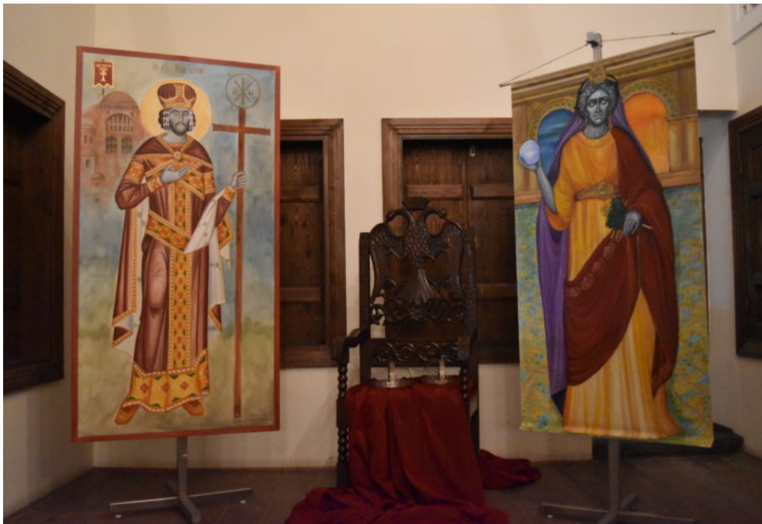
Πίνακες του Μεγάλου Κωνσταντίνου και της Ελένης της Κωνσταντινούπολης.