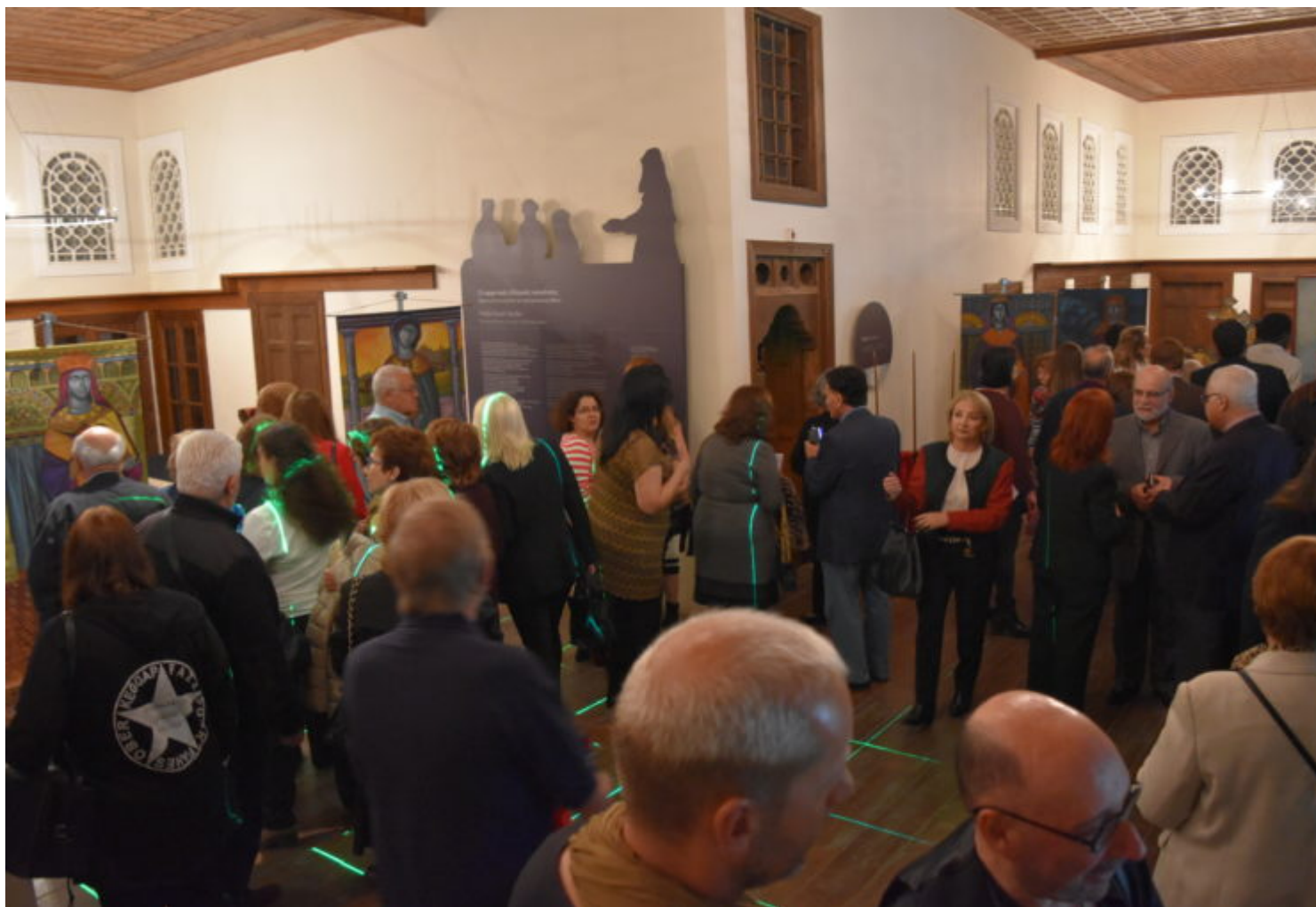
Στιγμιότυπο από την έκθεση ζωγραφικής «Αθανασία».

Η έκθεση, η οποία πραγματοποιήθηκε ακριβώς ένα χρόνο πριν στην Κωνσταντινούπολη, σε μία Κινστέрна του δού αιώνα, θα διαρκέσει από τις 5 έως τις 14 Νοεμβρίου και θα είναι ανοιχτή τις μέρες Τρίτη-Πέμπτη από τις 10:00 έως τις 13:00 και την Κυριακή από τις 11:00 έως τις 16:00.