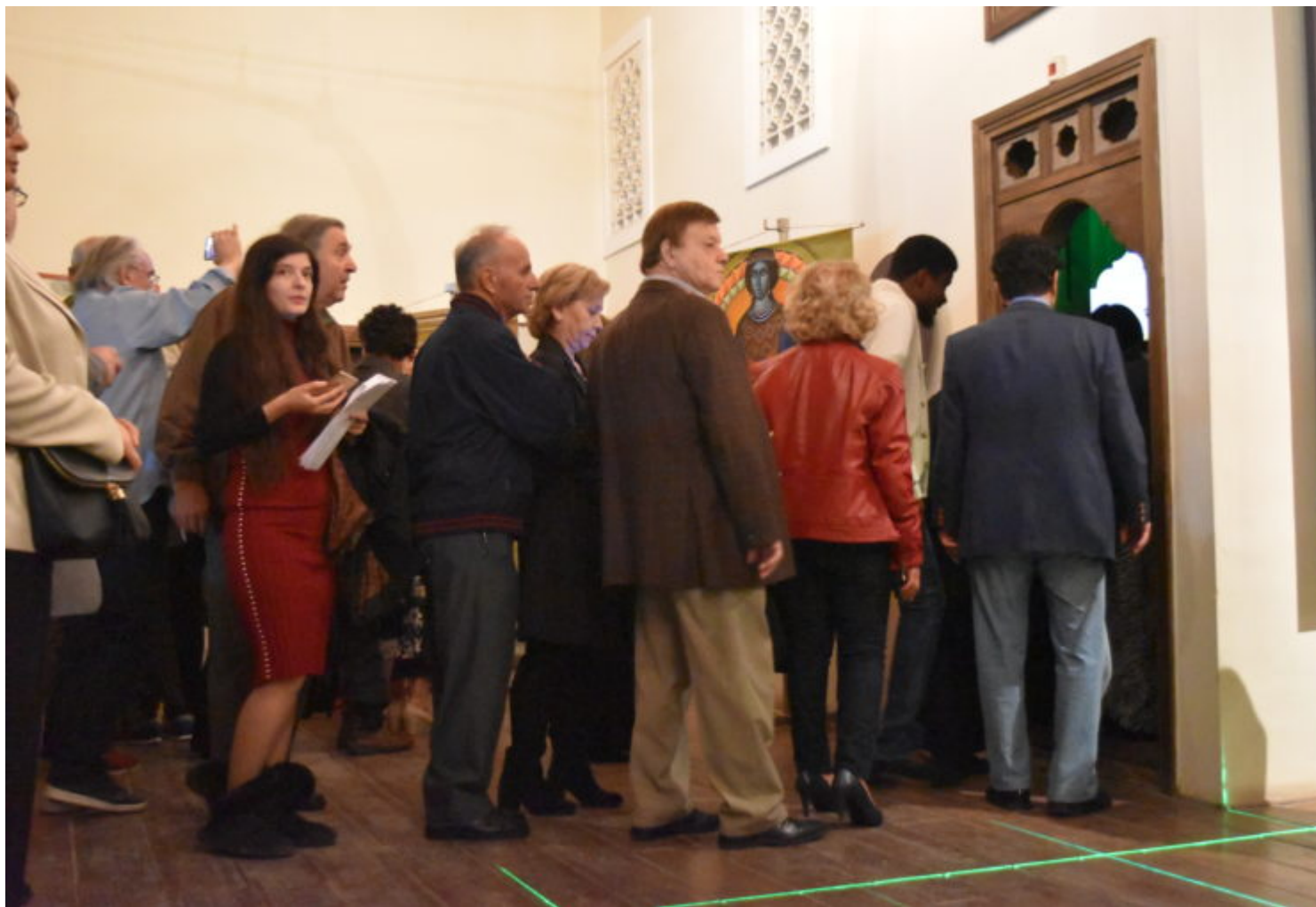
Στιγμιότυπο από την έκθεση ζωγραφικής «Αθανασία».