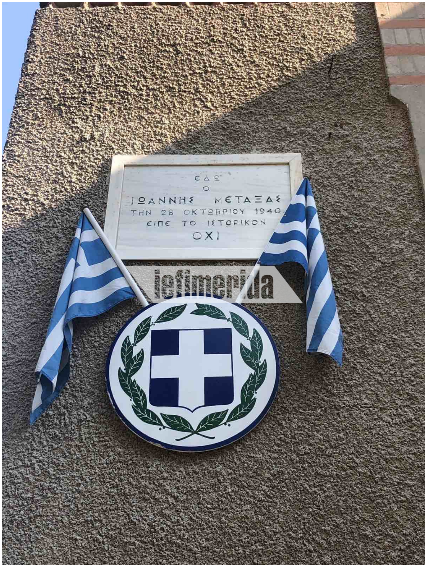
Η επιγραφή στον τοίχο της βίλας