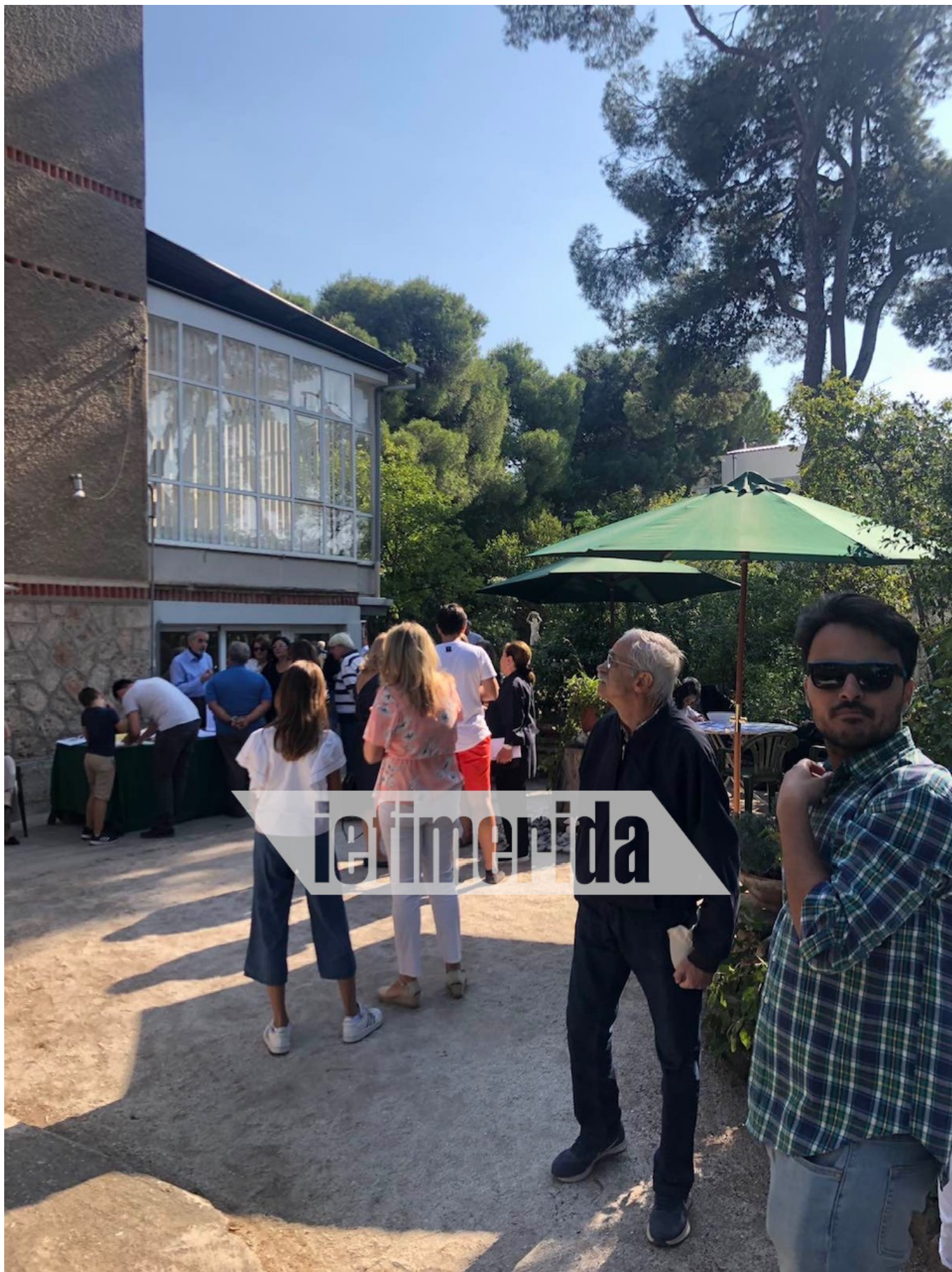
Πλήθος κόσμου επισκέπτεται το σπίτι σε κάθε επέτειο του ΟΧΙ