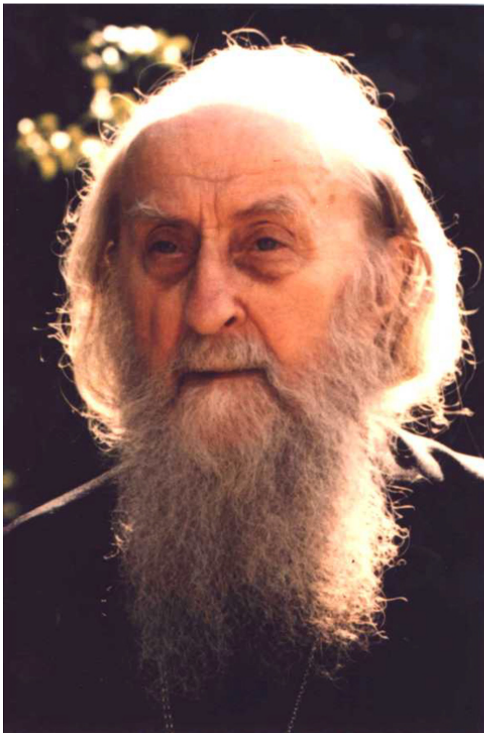
Όσιος Σωφρόνιος του Έσσεξ (1896-1993).

Η πορεία με το Θεό δεν είναι πάντα ανώδυνη για τον άνθρωπο. Το ίδιο δεν είναι πάντοτε εύκολη και η ζωή με τους αγίους. Πολλοί σκέφτονται μ' αφέλεια πως όλα είναι ευχάριστα με τους αγίους· λυπούνται γιατί ζουν ανάμεσα σ' αμαρτωλούς και νοσταλγούν να συναντήσουν έναν άγιο.