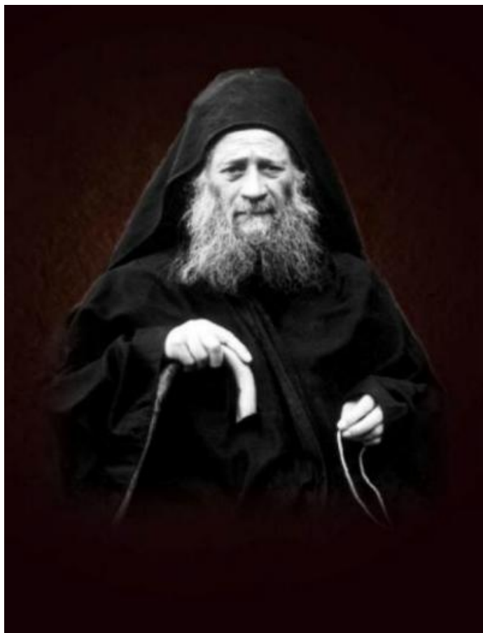
Όσιος Ιωσήφ Ησυχαστής (1898-1959).

Πάμπολλα παραδείγματα στην ιστορία των ανθρώπων μάς πείθουν για την σωτηρία από επικείμενους ολέθρους εξαιτίας της προσευχής εναρέτων προσώπων. Με τον τρόπο αυτόν εκδηλώνουν οι τέλειοι εν Θεώ τις δύο κύριες αρετές τους· την αγάπη και την προσευχή.