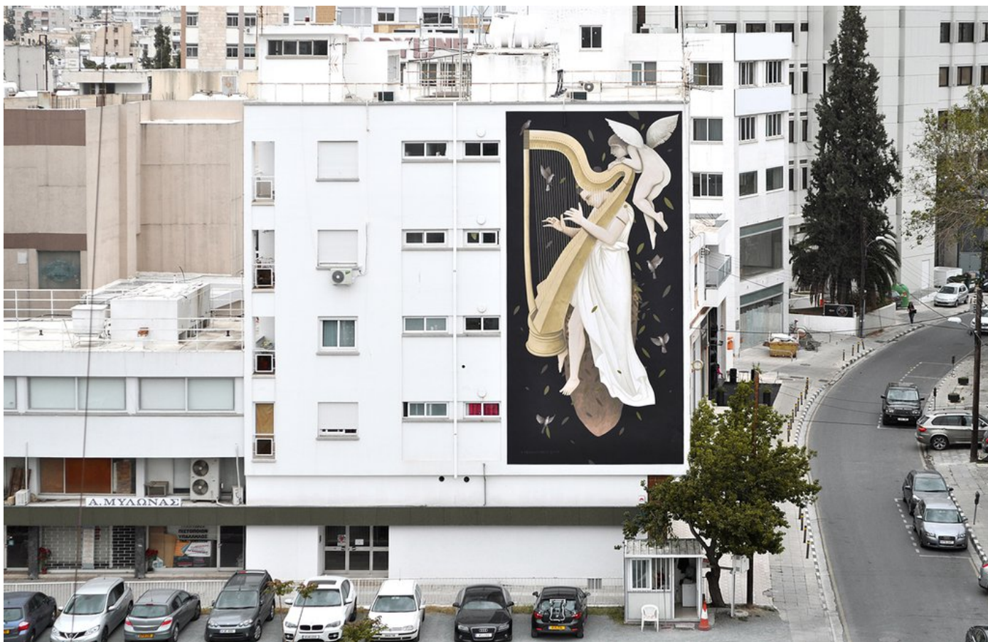
Γοργώ, έργο του Φίκου στην Λευκωσία

Στο μυαλό μου στριφογυρνάει η εξήγησή του σχετικά με τη λάθος ερμηνεία των αγγέλων ως θρησκευτικό σύμβολο και επαναφέρω την κουβέντα, ζητώντας του να μου εξηγήσει πώς φτάσαμε να θεωρούμε τον «άγγελο» ως ένα κατ' εξοχήν θρησκευτικό σύμβολο. «Μορφές με φτερά απεικονίζονται χιλιάδες χρόνια πριν το Χριστιανισμό, σε ανατολικούς πολιτισμούς όπως των Σουμερίων, των Ακκαδίων και άλλων. Οι Έλληνες, επηρεασμένοι από την τέχνη αυτών των λαών, άρχισαν να δημιουργούν τα δικά τους φτερωτά πλάσματα (Πήγασος, Χίμαιρα, Τάλως κα) από τον 9ο π.Χ. αι. και μετά.