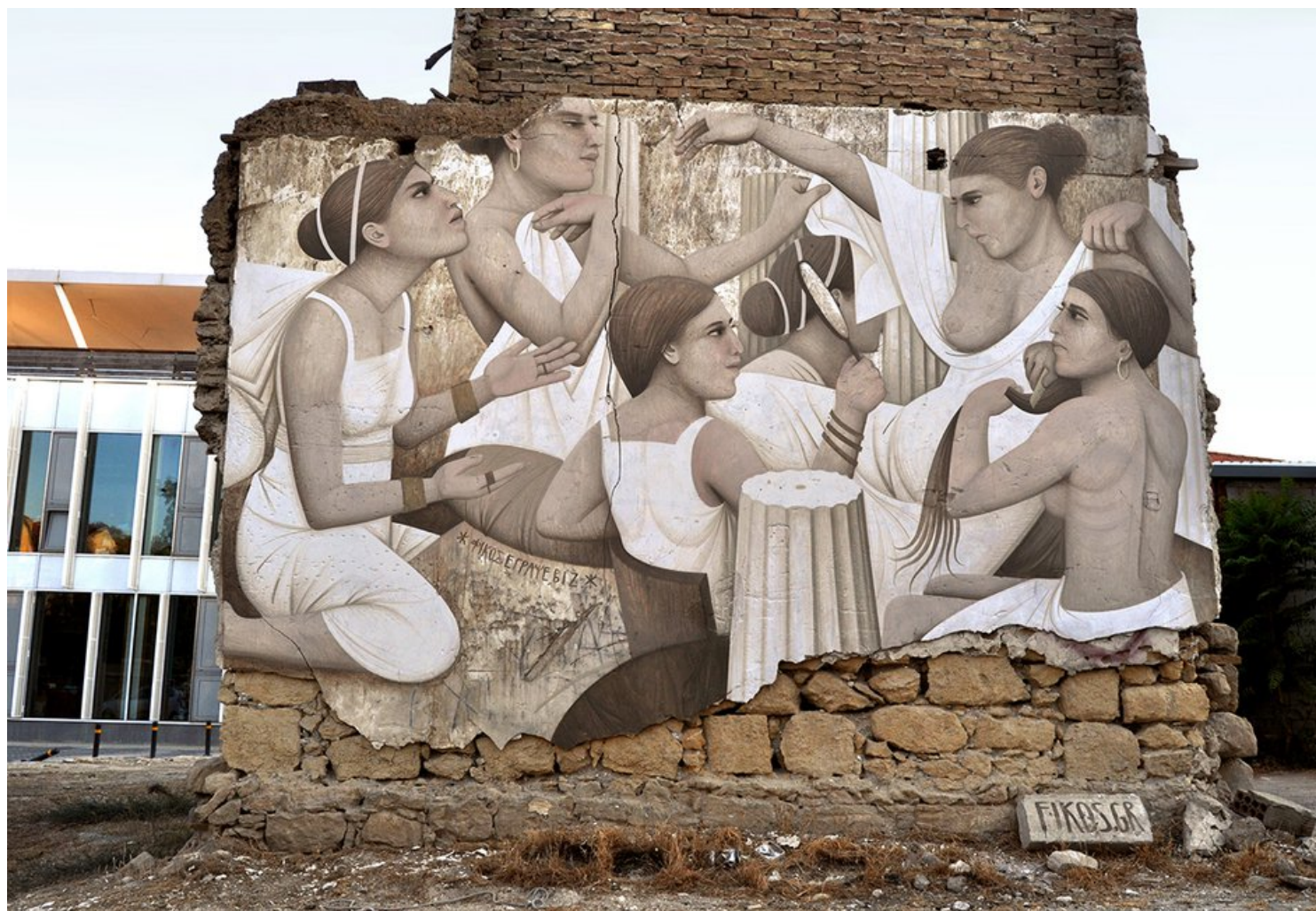
Ιέριεις της Αφροδίτης, έργο του στο κέντρο της Λεύκωσας

Δεν του αρέσει να μιλάει πολύ, ιδίως όταν δημιουργεί. Προτιμά τη μουσική του. Κάθομαι στο πλάι και τον παρατηρώ με πόση προσήλωση δουλεύει. Σκιάσεις, λεπτομέρειες, ανακάτεμα της μπογιάς. Μια διαδραστική εικόνα τέχνης, που δημιουργεί μια άλλη, πιο στατική.