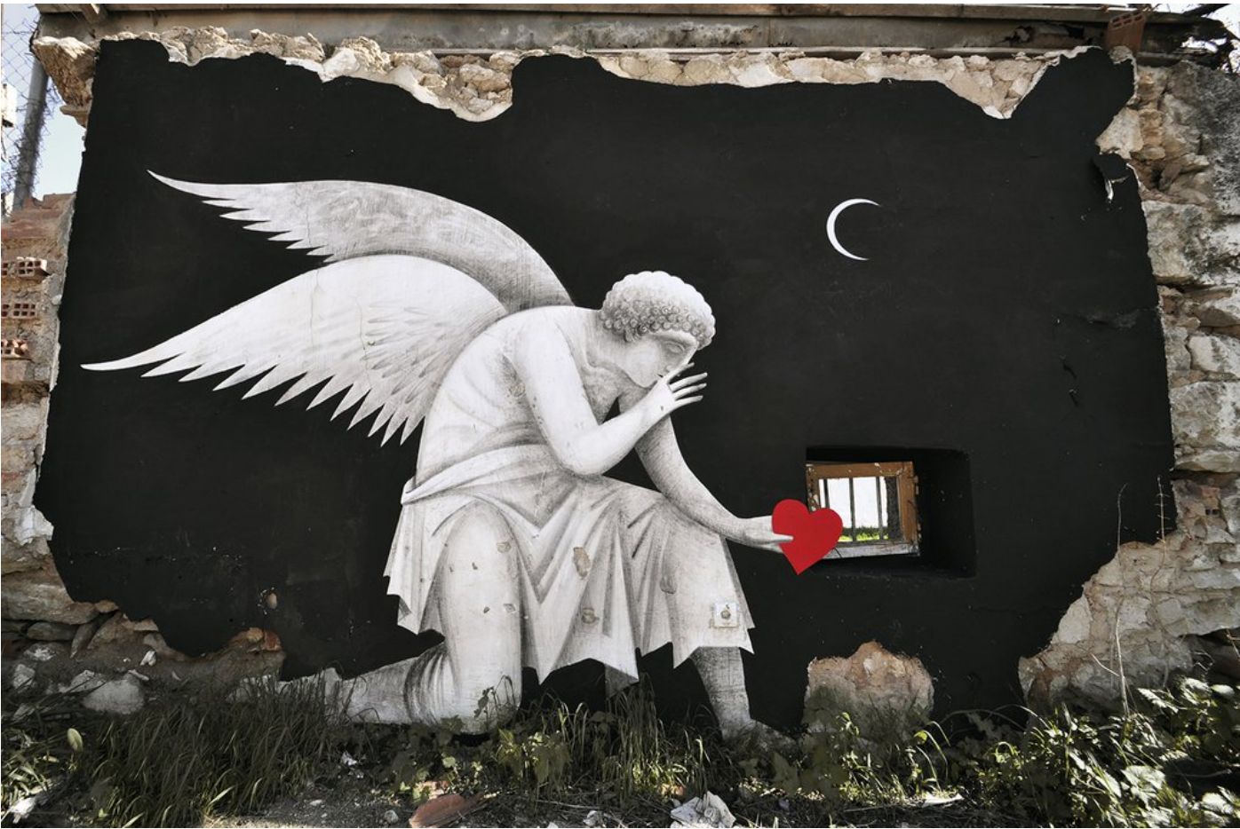
Άγγελοι, από τη σειρά Wasted Love