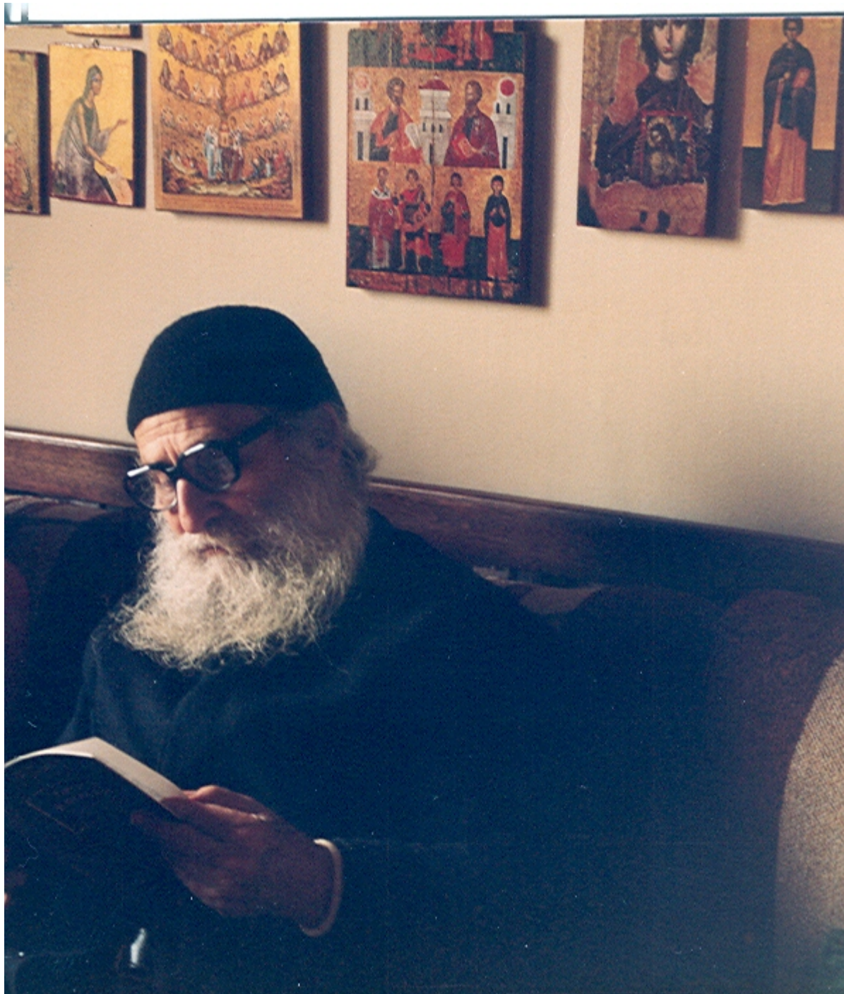
Γέρων Ιωσήφ Βατοπαιδινός.

Η ακηδία είναι ο τρομερότερος εχθρός της πνευματικής ζωής. Όλα τα πάθη άπτονται εν μέρει της ανθρώπινης υποστάσεως, αλλά αυτό το τρομερό κακό η ακηδία ή αμέλεια άπτεται και του ψυχικού και σωματικού κόσμου του ανθρώπου. Σαλεύει το σύνολο της ανθρώπινης υποστάσεως.