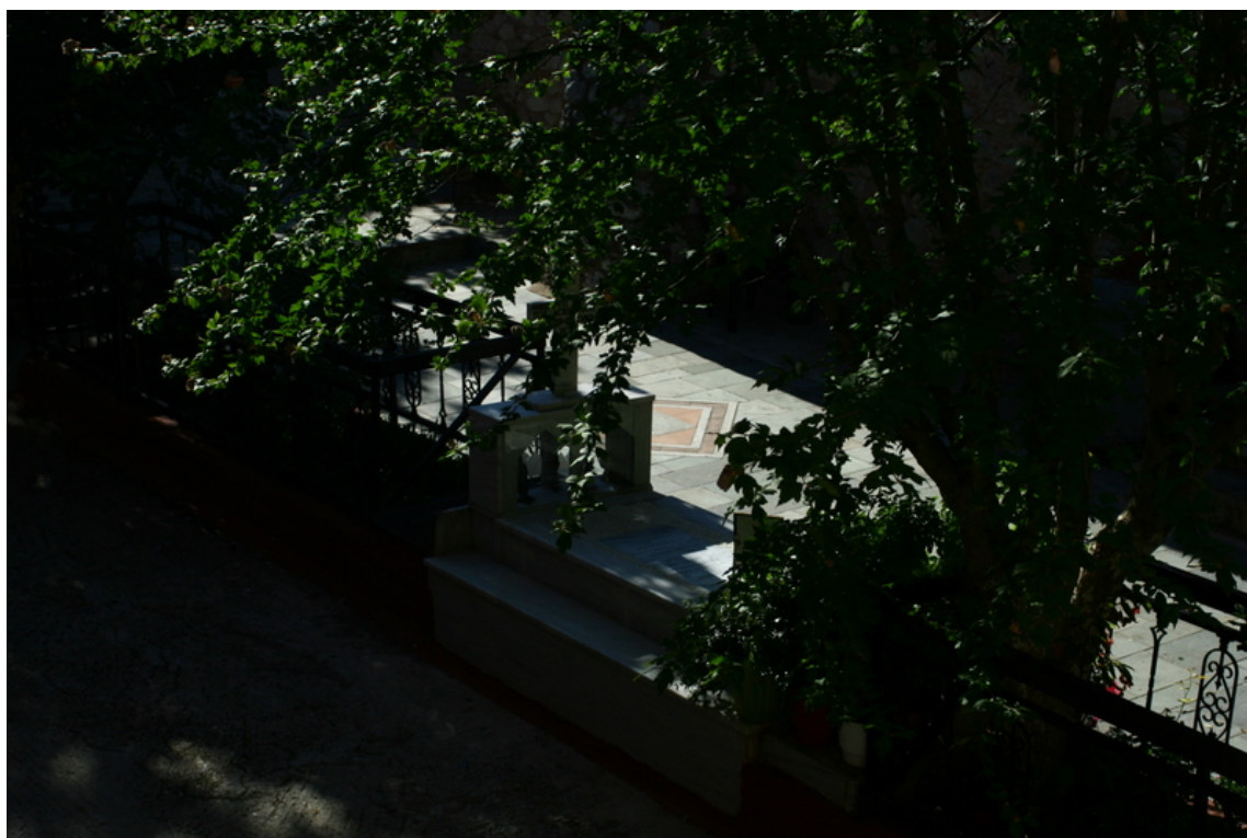
Εσωτερικός χώρος της Μονης.