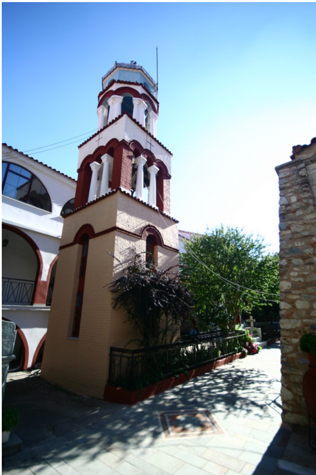
Το καμπαναριό της Μονής