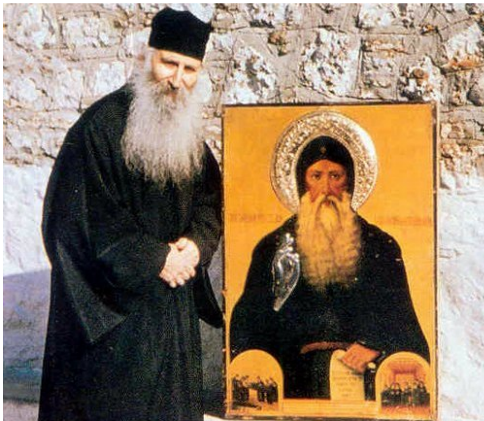
Ο Όσιος Ιάκωβος Τσαλίκης νέος Κτήτορας της Μονής του Οσίου Δαβίδ με την εικόνα τοθ ιδίου του Οσίου Δαβίδ