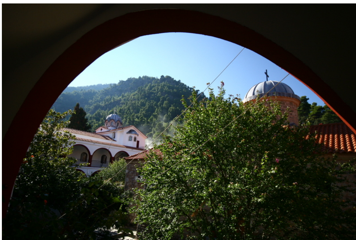
Θέα απο το καμπαναριό της Μονής