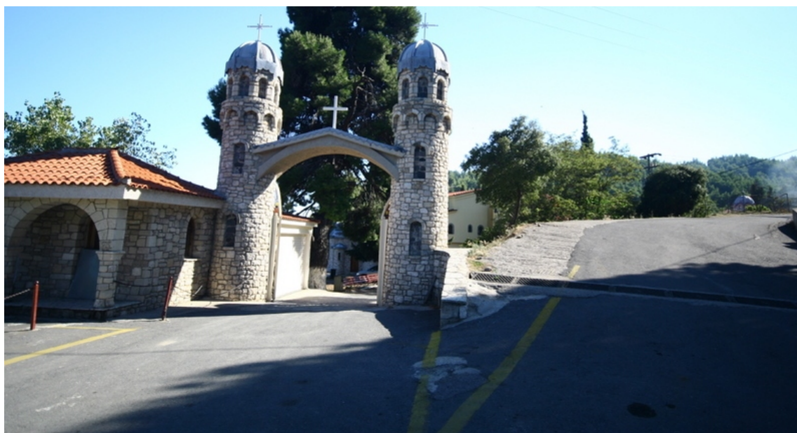
Ο υπαίθριος χώρος, εκτός της μονής.