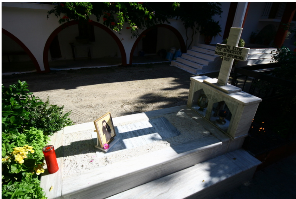
Ο τάφος του Αγίου Ιακώβου Τσαλίκη