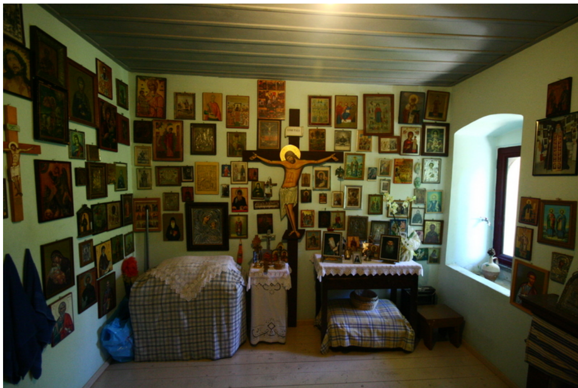
Το εσωτερικό του κελιού του Αγίου Ιακώβου Τσαλίκη