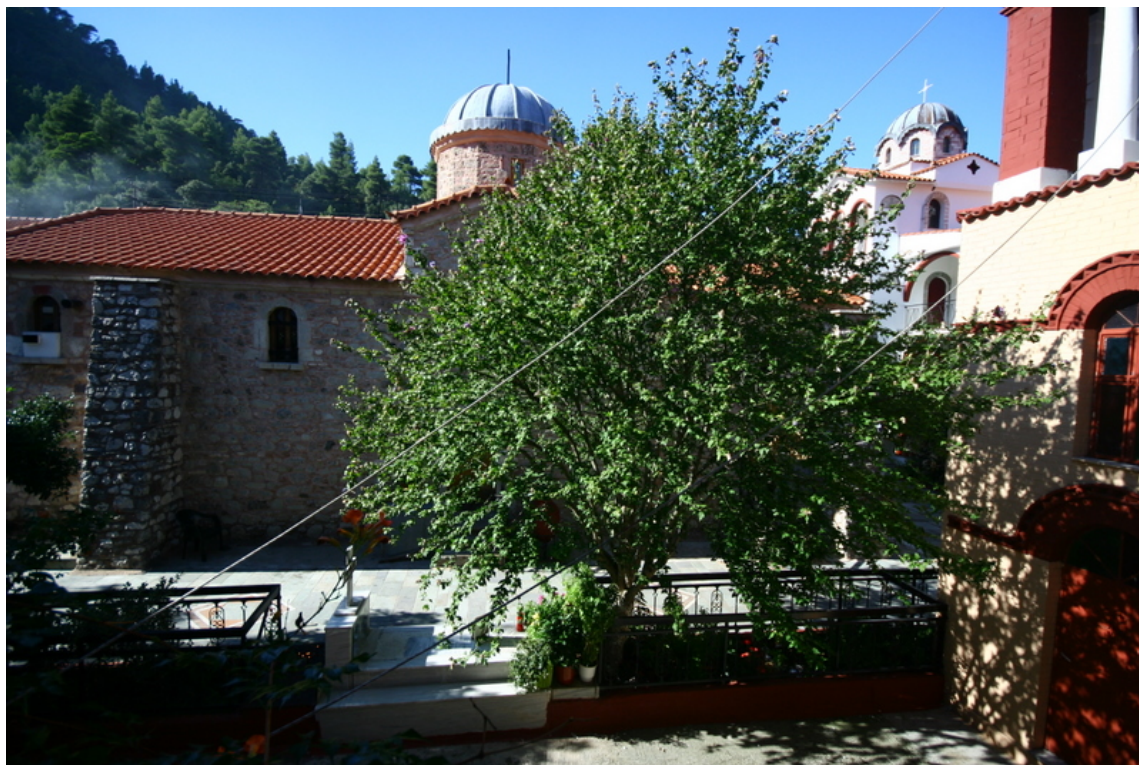
Το καθολικό της Μονής