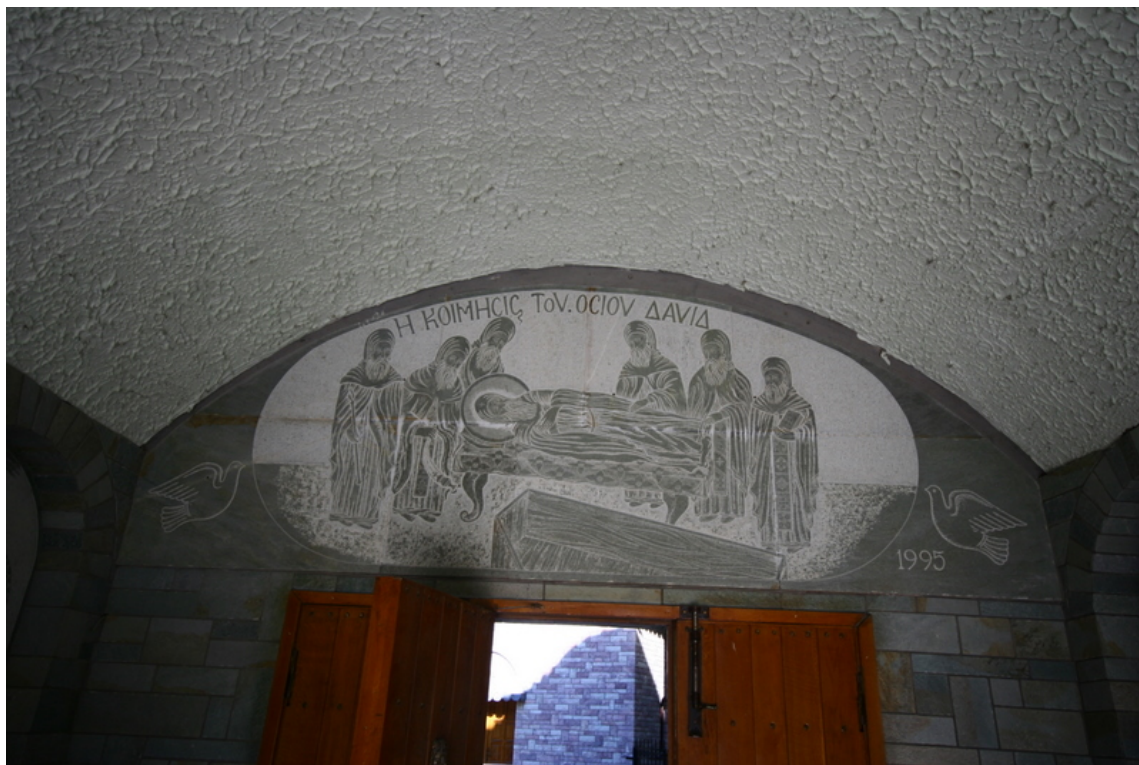
Λιθογραφία επάνω από την είσοδο εσωτερικά της Μονής. Άποψη της ανατολικής πτέρυγας της Ιεράς Μονής.