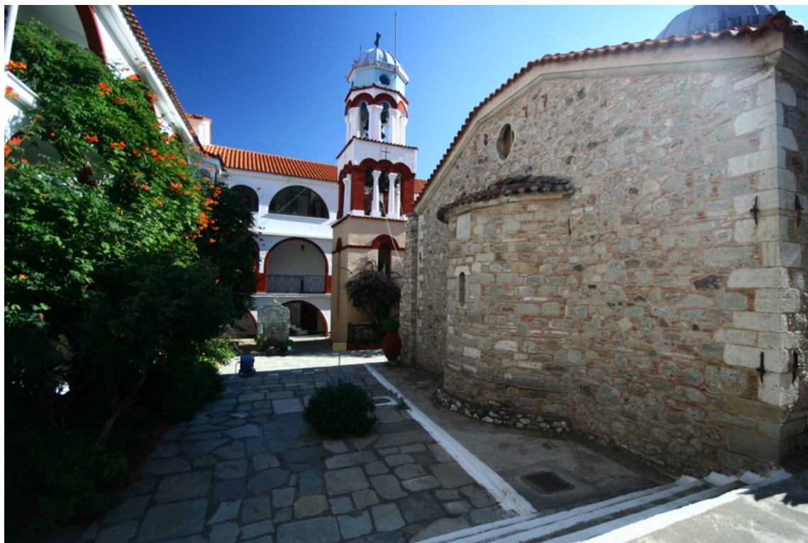
Δυτική άποψη της Μονής