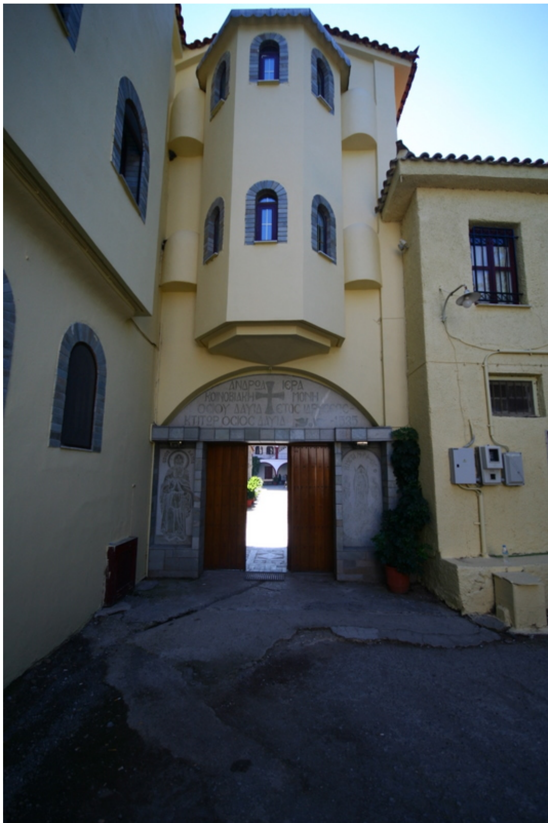
Η είσοδος της Ιεράς Μονής του Οσίου Δαβίδ