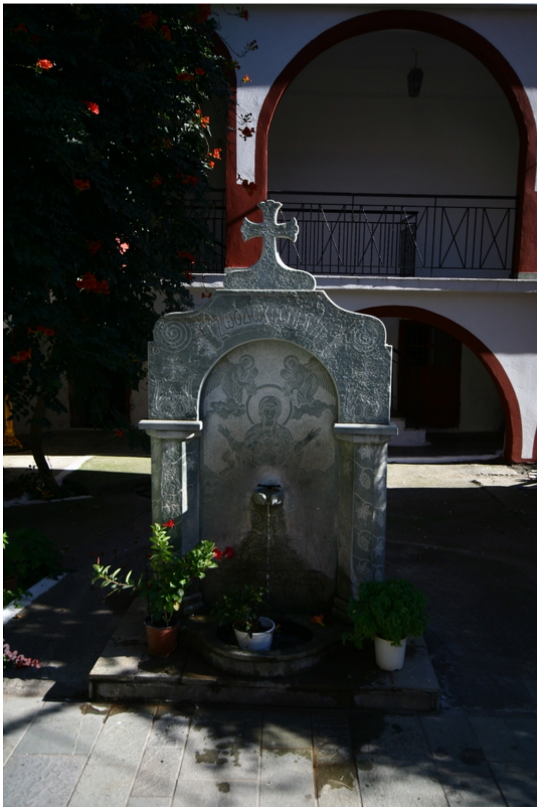
Η βρύση «Ζωοδόχος Πηγή» στην αυλή της μονής απο την οποία τρέχει "αγίασμα"