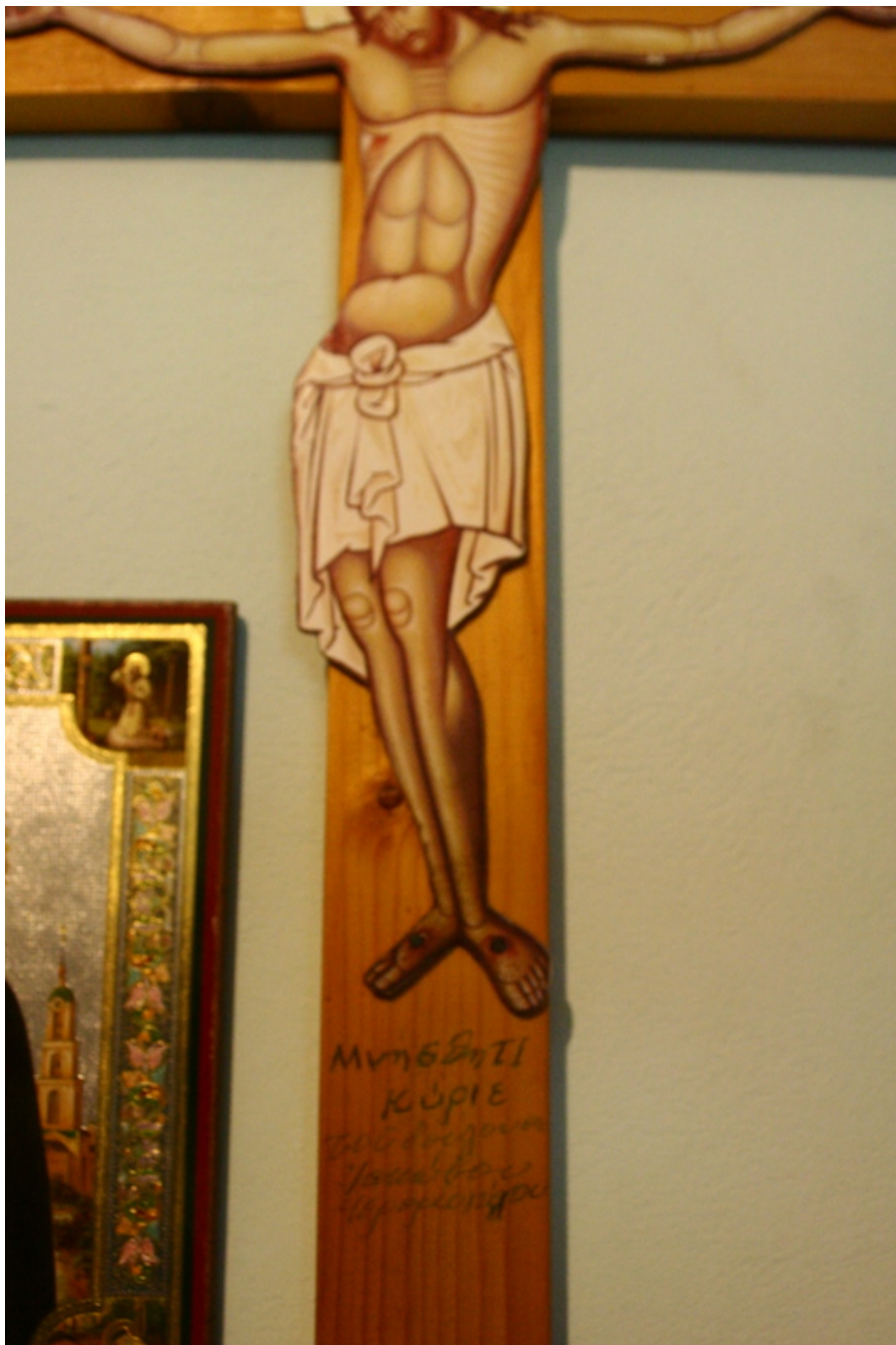
Λίγες μέρες πριν την κοίμησή του, ο Άγιος Ιάκωβος Τσαλίκης έγραψε στο σταυρό "Μνήσθητι Κύριε του δούλου σου Ιακώβου Ιερομονάχου"