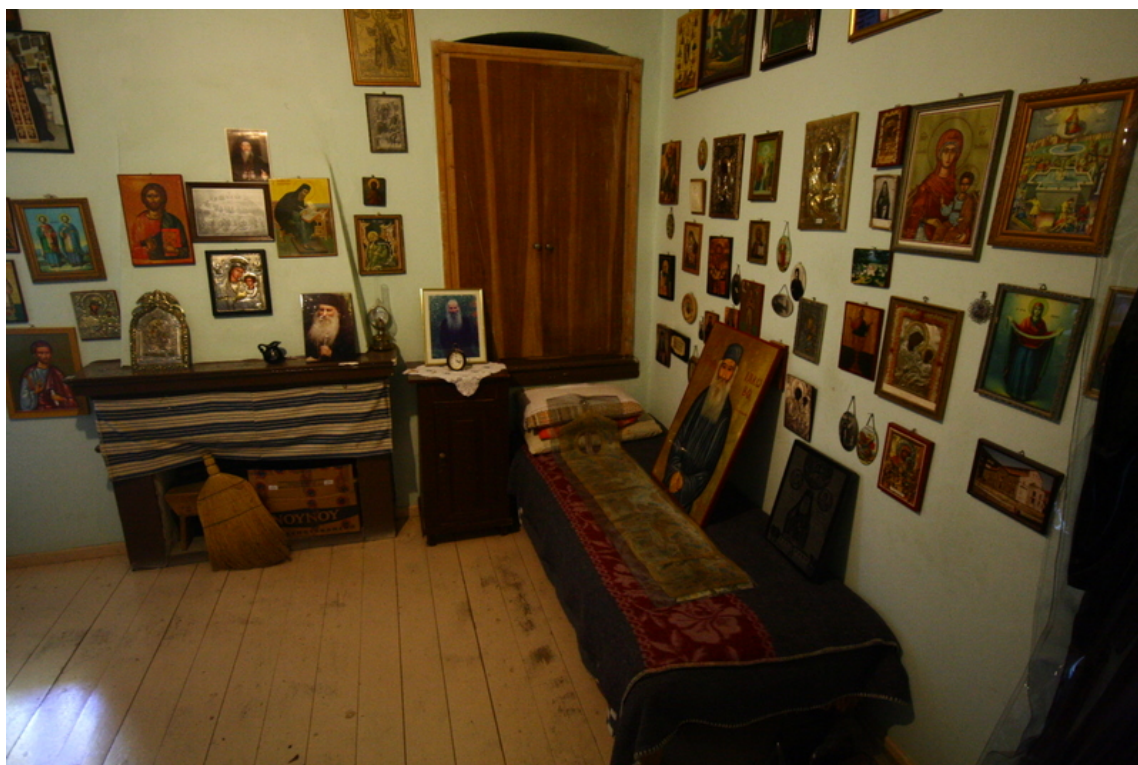
Το εσωτερικό του κελιού του Αγίου Ιακώβου Τσαλίκη