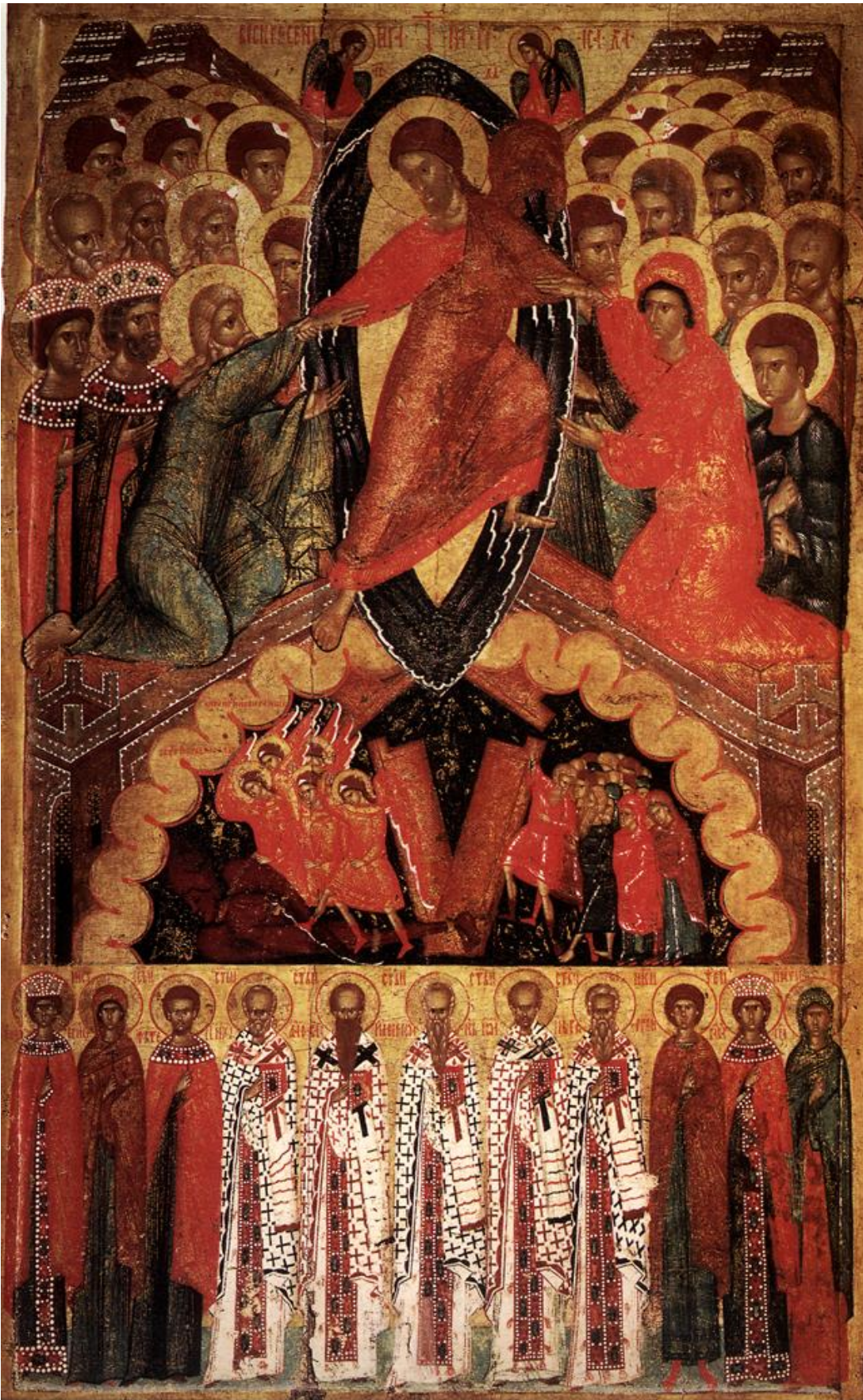
Η Ανάσταση του Χριστού με παραστάσεις Αγίων. Ρωσικό Μουσείο, Αγία Πετρούπολη. Σχολή Πσκόφ, τέλη 15ου - αρχές 16ου αιώνα.