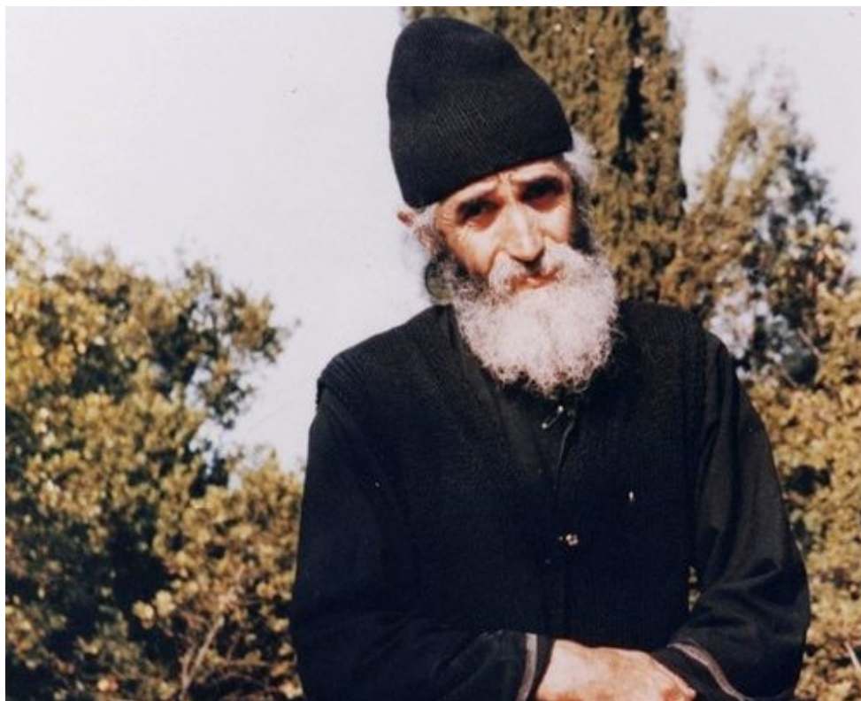
Άγιος Παΐσιος Αγιορείτης (1924-1994).

Ο Χριστός είναι παντοδύναμος. Ο πειρασμός είναι σάπιος. Σταυρό δεν φοράς; Τα όπλα του διαβόλου είναι αδύναμα. Ο Χριστός μάς έχει οπλίσει με τον Σταυρό Του.