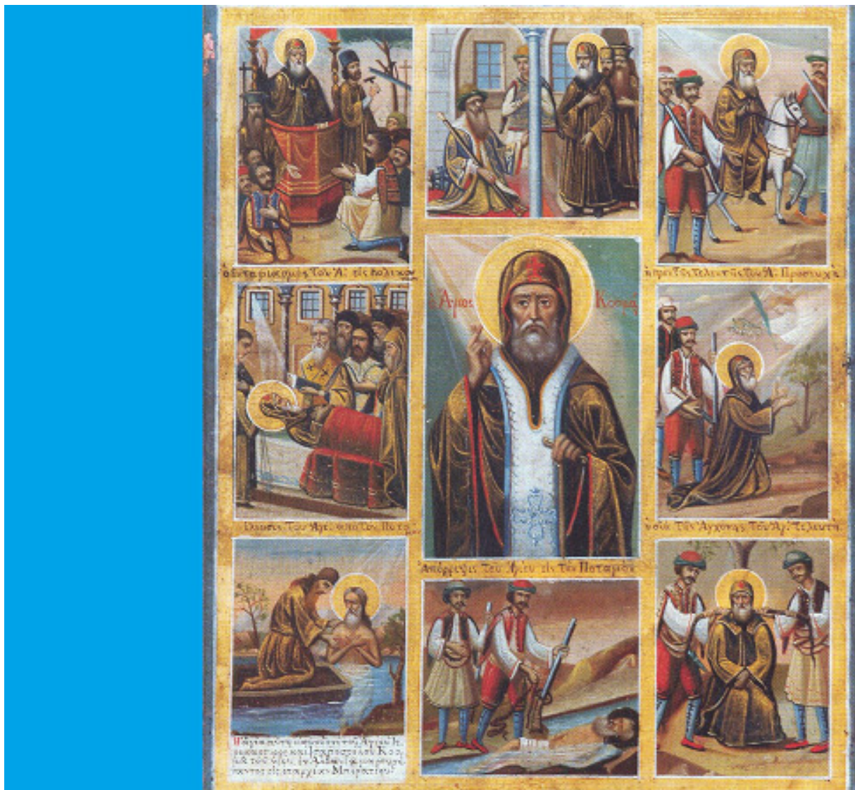
Ο Άγιος Κοσμάς ο Αιτωλός, με σκηνές του μαρτυρίου του. Φορητή εικόνα Ι. Κ. Αγίας Άννης - Καρυών (19ος αι.). Από το βιβλίο "Οι Άγιοι του Αγίου Όρους" του Μοναχού Μωυσέως Αγιορείτου (εκδ. Μυθονία)

Να απέχετε, αδελφοί μου, οι κοσμικοί να μην κατηγοράτε τους παπάδες σας, να μην τους υβρίζετε και να μην τους παραμελήτε, διατί βάνετε φωτιά και καίεστε, διατί οι παπάδες είναι ανώτεροι και από βασιλείς, ανώτεροι και από τους αγγέλους.