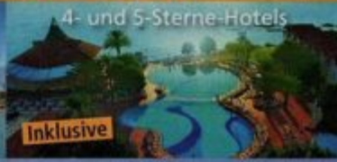
4- und 5-Sterne-Hotels