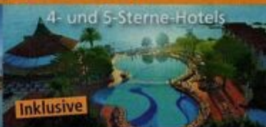
4- und 5-Sterne-Hotels