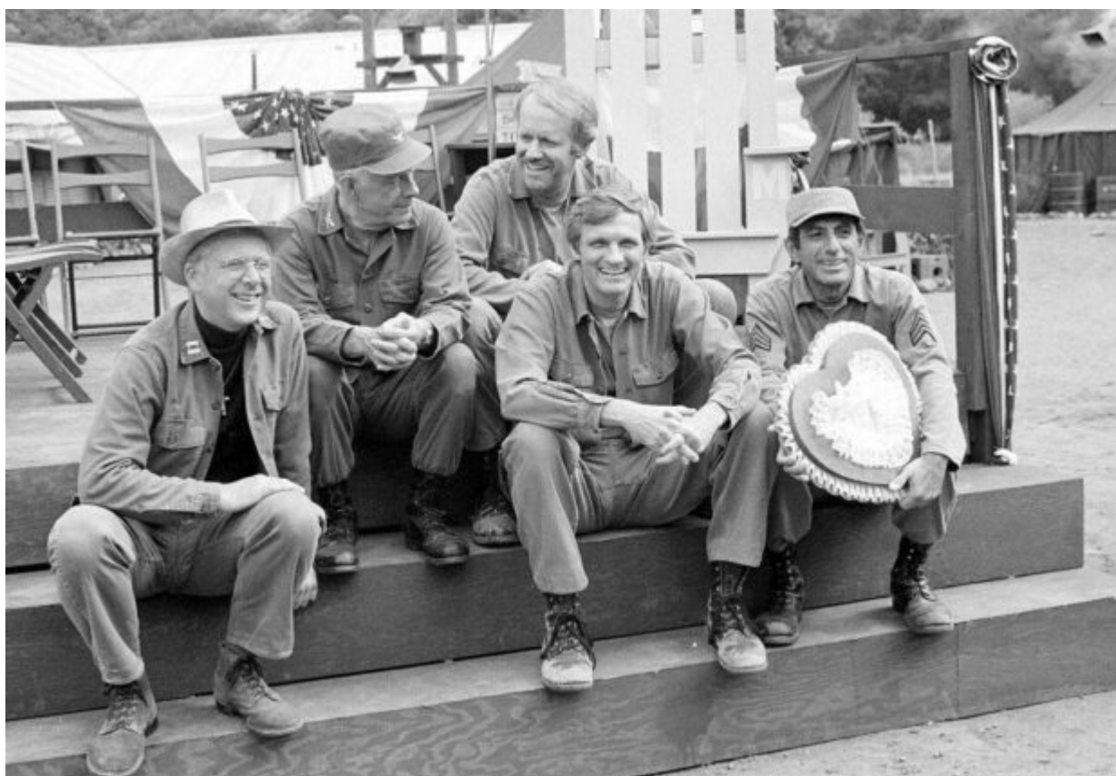
Οι πρωταγωνιστές (από αριστερά προς δεξιά): William Christopher, Harry Morgan, Mike Farrell, Alan Alda, and Jamie Farr