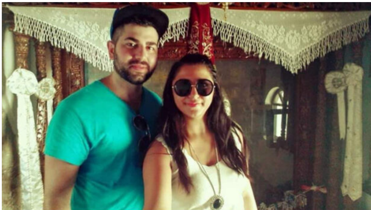
Από το πρώτο τους προσκύνημα στην Παναγιά Τσαμπίκα πριν από 3 χρόνια