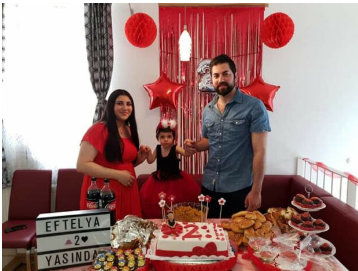
Στα γενέθλια της κόρης τους όταν έκλεισε τα δύο της χρόνια

Σίγουρα θα έρθουμε πάλι. Πήγαμε πριν από δύο μέρες στ' Αφάντου και τυχαία βρεθήκαμε μπροστά σε μια γυναίκα που μας είπε ότι κι εκείνη προσπαθούσε επτά χρόνια να κάνει παιδί και το έκανε με τη βοήθεια της Παναγιάς Τσαμπίκας. Έγινε το ίδιο θαύμα και σ' εκείνην κι εμείς έχουμε ζητήσει από την Παναγία, κι άλλο μωρό.