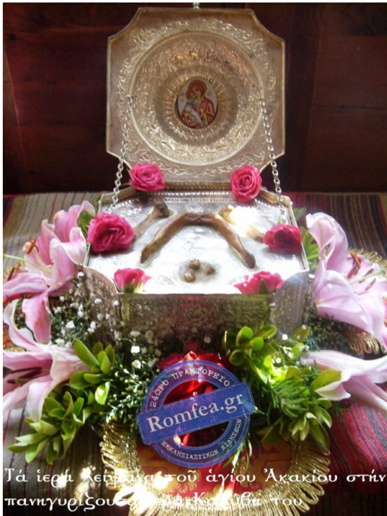
Τὰ ἱερά λείψανα τοῦ ἁγίου Ἀκακίου στὴν πανηγυρικοῦ ἐπιπέδα Κορυθίου του