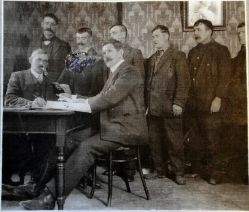
The National Sailors' and Firemen's Union provided shipwreck pay to surviving members of the Titanic's crew.