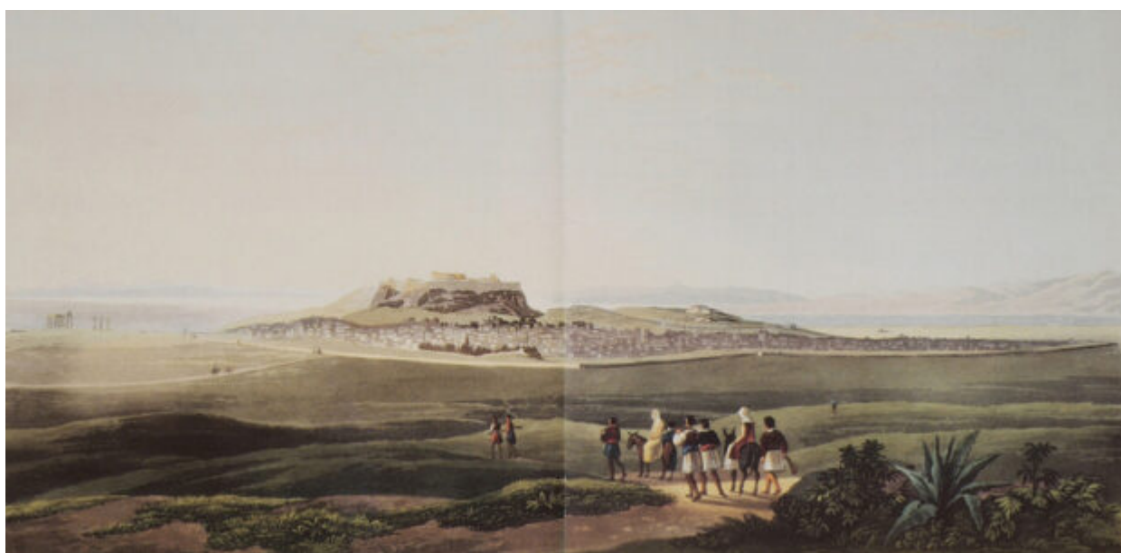
Η Αθήνα από τα Τουρκοβούνια. Χαρακτικό από έκδοση του Ed. Dodwell.

Το αρχαίο όνομα διατηρήθηκε έως τον 3ο-5ο αιώνα μ.Χ. οπότε ο λόφος μετονομάστηκε σε Λυκοβούνια. Σύμφωνα με το έργο άγγλου περιηγητή και γεωγράφου των μέσων του 18ου αιώνα, η λοφοσειρά που διέσχιζε το λεκανοπέδιο Αθηνών προς τα Βορειοανατολικά είχε αποβάλει το αρχαίο όνομα «Αγχεσμός» και αναφερόταν με το όνομα Τουρκοβούνια, που περιελάμβανε και τον Λυκαβηττό.