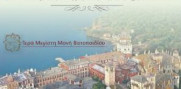
Ιερά Μεγίστη Μονή Βατοπαιδίου

« Αξίον έστιν ως άληθώς μακαρίζειν σε την Θεοτόκου ». Μεγαλνάριο της Υπεραγίας Θεοτόκου. Μέλος Μισαήλ Χα- τζηθρανασίου, Πρωτοψάλτου της Ιεράς Μονής Ζωοδόχου Πηγής Μπαλουκλή Κυνη/Μεως (+1948). Ύχος α΄.