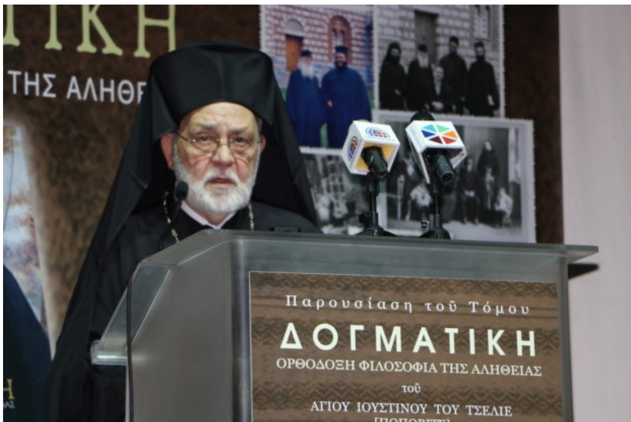
Ο Άγιος Ιουστίνος Πόποβιτς

Ο Άγιος Ιουστίνος Πόποβιτς είναι ένας από τους μεγαλύτερους θεολόγους της εποχής μας, πνευματικός πατέρας της Εκκλησίας της Σερβίας και όλης της