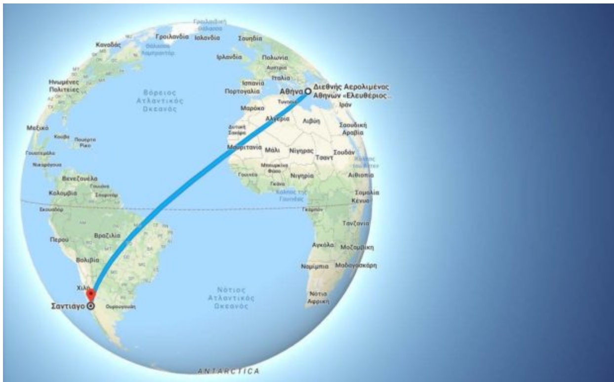
Η απόσταση της Αθήνας από το Σαντιάγο υπολογίζεται σε 12.546 χλμ

Στη Χιλή, πέραν της πρεσβείας, που είτε συνδιοργανώνει είτε θέτει υπό την αιγίδα της πολιτιστικές εκδηλώσεις υπάρχουν πολλοί και σημαντικοί φορείς που δραστηριοποιούνται στον τομέα αυτό, όπως αναφέρει το ελληνικό υπουργείο Εξωτερικών. Ανάμεσα σε αυτούς είναι το Κέντρο Κλασικών Σπουδών του Πανεπιστημίου Metropolitana του Σαντιάγο, το Ελληνο-χιλιανό Εμπορικό και Πολιτιστικό Επιμελητήριο, το Ίδρυμα Γαβριήλ και Μαρίας Μουστάκη, ο Σύλλογος Φίλων Ν. Καζαντζάκη και άλλα.