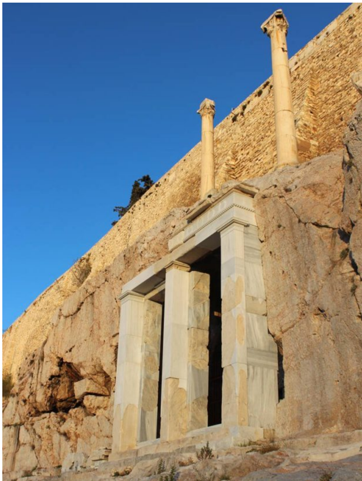
Το χορηγικό μνημείο του Θρασύλλου μετά την ολοκλήρωση της αναστήλωσής του τον Ιανουάριο του 2017

Μετά την κατάργηση του Ταμείου Διαχείρισης Πιστώσεων για την Εκτέλεση Αρχαιολογικών Έργων, που διαχειριζόταν τα κονδύλια του έργου έως το 2013, η χρηματοδότηση διεκόπη. Τον Ιούλιο του 2014, το έργο εντάχθηκε στο Πρόγραμμα