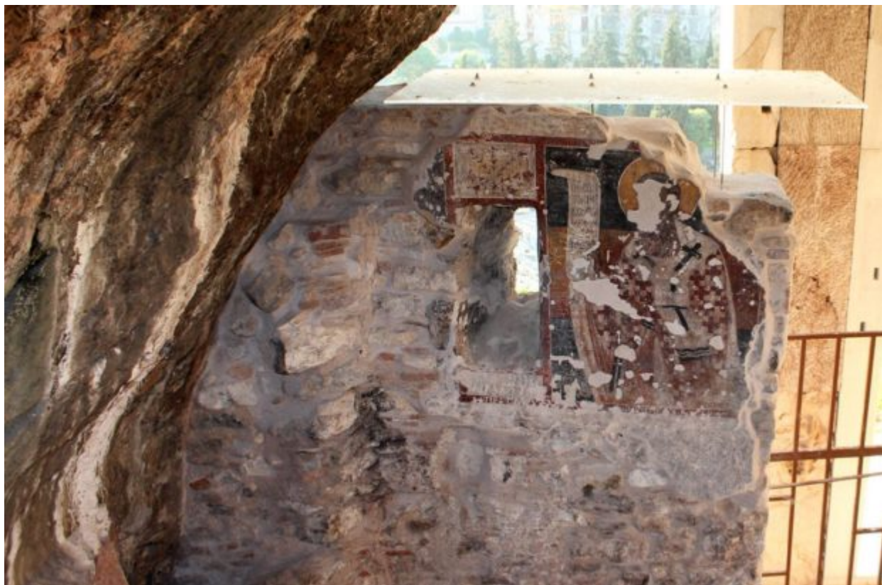
Ο Ιεράρχης που κοσμεί την εσωτερική παρειά του νότιου τοίχου της Παναγίας Σπηλιώτισσας μετά την συντήρησή του από το τμήμα Συντήρησης της Εφορείας Αρχαιοτήτων Αθηνών. Ο νότιος τοίχος, όπως και ο βόρειος, στερεώθηκε και, σε μεγάλη έκταση, αρμολογήθηκε εκ νέου από τους μαρμαροτεχνίτες του τμήματος Αρχαιολογικών Έργων και Μελετών της Εφορείας Αρχαιοτήτων Αθηνών

Δύο τοίχοι στους οποίους σώζονται σημαντικά τμήματα του τοιχογραφικού τους διακόσμου συμβάλλουν στην υποτυπώδη εσωτερική οργάνωση της εκκλησίας.