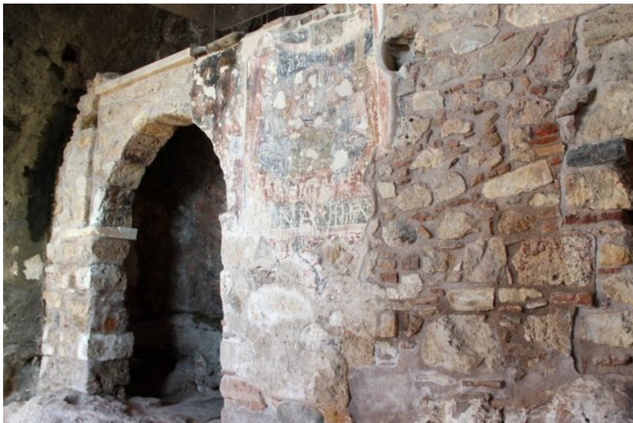
Ο βόρειος τοίχος της Παναγίας Σπηλιώτισσας μετά την αποκατάσταση του τοξωτού ανοίγματός του και την συντήρηση του τοιχογραφικού διακόσμου του

«Ο τοιχογραφικός διάκοσμος της Παναγίας της Σπηλιώτισσας περιλαμβάνει τα καλύτερα σωζόμενα δείγματα μεταβυζαντινής αγιογραφίας στην περιοχή της Ακροπόλεως και των κλιτύων της», μας λέει ο Δρ Κωνσταντίνος Μπολέτης Αρχιτέκτων-Αναστηλωτής της Εφορείας Αρχαιοτήτων της πόλης των Αθηνών.