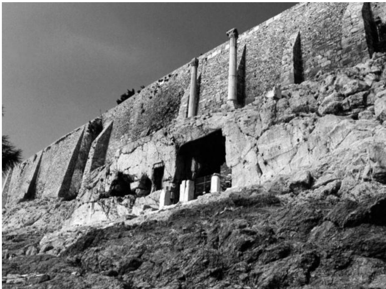
Το Θρασύλλειο το 2002, στην κατάσταση διατήρησής του πριν την έναρξη του αναστηλωτικού προγράμματος

Σε κεντρική θέση επάνω από το μνημείο, διακρίνεται στα περισσότερα έργα της ιστορικής εικονογραφίας ένα μαρμάρινο άγαλμα του Διονύσου, που είχε τοποθετηθεί, σύμφωνα με τις επικρατέστερες επιστημονικές απόψεις, στους ρωμαϊκούς χρόνους. Το άγαλμα αυτό, μας εξηγεί ο κ. Μπολέτης, αποσπάστηκε το 1802 για λογαριασμό του Λόρδου Έλγιν και εκτίθεται σήμερα στο Βρετανικό Μουσείο. Όσον αφορά στο χριστιανικό ναύδριο πίσω από την πρόσοψη του αρχαίου μνημείου, στοιχεία συνηγορούν υπέρ της χρονολόγησης των σωζόμενων καταλοίπων του κατά την περίοδο της Οθωμανικής Κυριαρχίας. Διαθέτει τριμερή εσωτερική διάρθρωση, η οποία ακολουθεί τη μορφή που είχε δοθεί στο σπήλαιο από τους αρχαίους χρόνους.