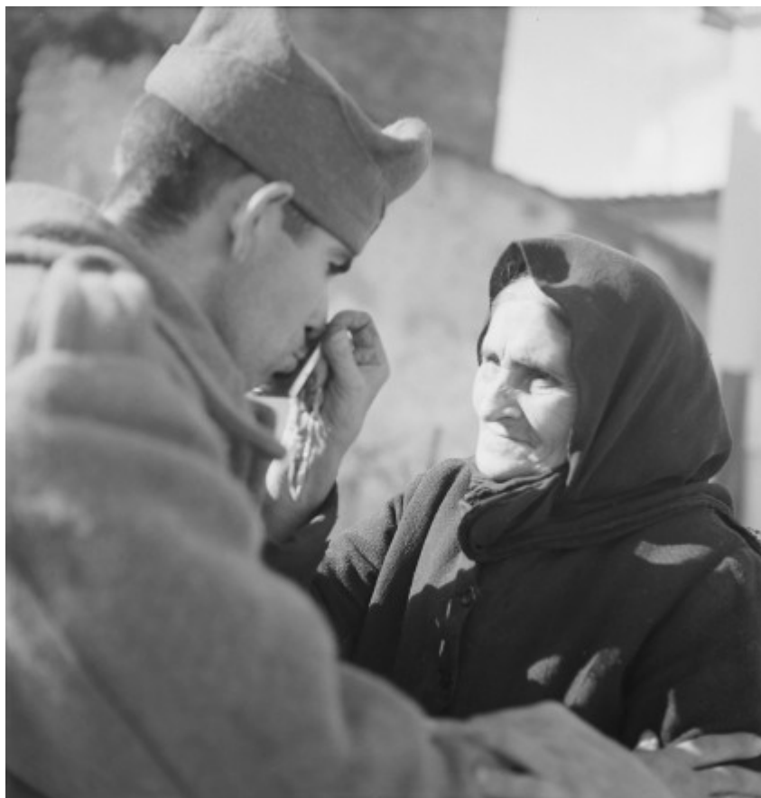
Βούλα Παπαϊωάννου, Επιστράτευση. Αθήνα, 1940

«Η φωτογραφία ήταν επάγγελμα και ερασιτεχνισμός μαζί» είχε πει σε μια συνέντευξή της το καλοκαίρι του 1989. «Σε μένα άρχισε ως ερασιτεχνισμός, καθαρός ερασιτεχνισμός. Εγώ δεν αγαπούσα τη φωτογραφία. Ο αδερφός μου ησχολείτο με τη φωτογραφία κι εγώ τον κορόιδευα. Μου έλεγε: “Δώσε το Α φάρμακο, το Β φάρμακο”. Δεν ανακατέυτηκα καθόλου, αλλά αγαπούσα πάρα πολύ την αρχαιολογία και βρισκόμουν συνεχώς στο Μουσείο.