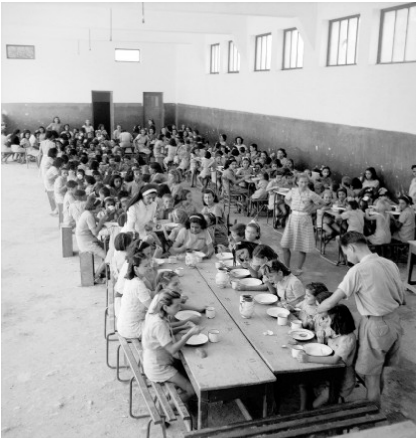
Βούλα Παπαϊωάννου, Συσσίτιο σε ίδρυμα για παιδιά. Αθήνα, 1942-43 © Μουσείο Μπενάκη / Φωτογραφικά Αρχεία

Περιέχει αποσπάσματα από το κείμενο της κ. Φανής Κωνσταντίνου από το βιβλίο «Η φωτογράφος Βούλα Παπαϊωάννου από το φωτογραφικό αρχείο του Μουσείου Μπενάκη» (Εκδόσεις Άγρα/Μουσείο Μπενάκη)