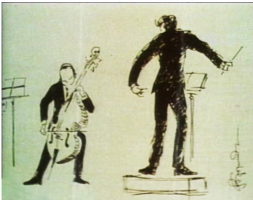
Σκίτσο της Έλλης Σολομωνίδου που απεικονίζει την σύμπραξη, ως σολίστ, του Ανδρέα Ροδουσάκη με τη ΜΟΑ, με μαέστρο τον Μίκη Θεοδωράκη