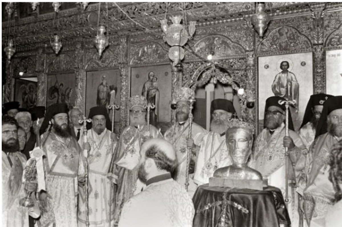
Αρχιερατικό συλλείτουργο το 1967 στην Μονή του Αποστόλου Ανδρέα στην Καρπασία προεξάρχοντος του μακαριστού Αρχιεπισκόπου Μακαρίου Γ΄

Παρόμοιες αναφορές γίνονται και από πολλούς περιηγητές που επισκέφθηκαν την Κύπρο, τόσο κατά την περίοδο της λατινοκρατίας (1191-1571) όσο και κατά την περίοδο της τουρκοκρατίας (1571-1878). Ο Άγγλος περιηγητής Richard Pococke, που επισκέφθηκε το νησί το 1738, γράφει, «φθάσαμε στο ανατολικότερο σημείο του νησιού, που ονομαζόταν από τους παλαιούς Βοός Ουρά. Σήμερα ονομάζεται ακρωτήριο του Αποστόλου Ανδρέα εξαιτίας μοναστηριού σε βράχο στο όνομα του Αποστόλου Ανδρέα, στο οποίο κατοικούν 2-3 μοναχοί». (Ν. Γ. Κυριαζή «Τα Μοναστήρια εν Κύπρω», 1950, σ. 18).