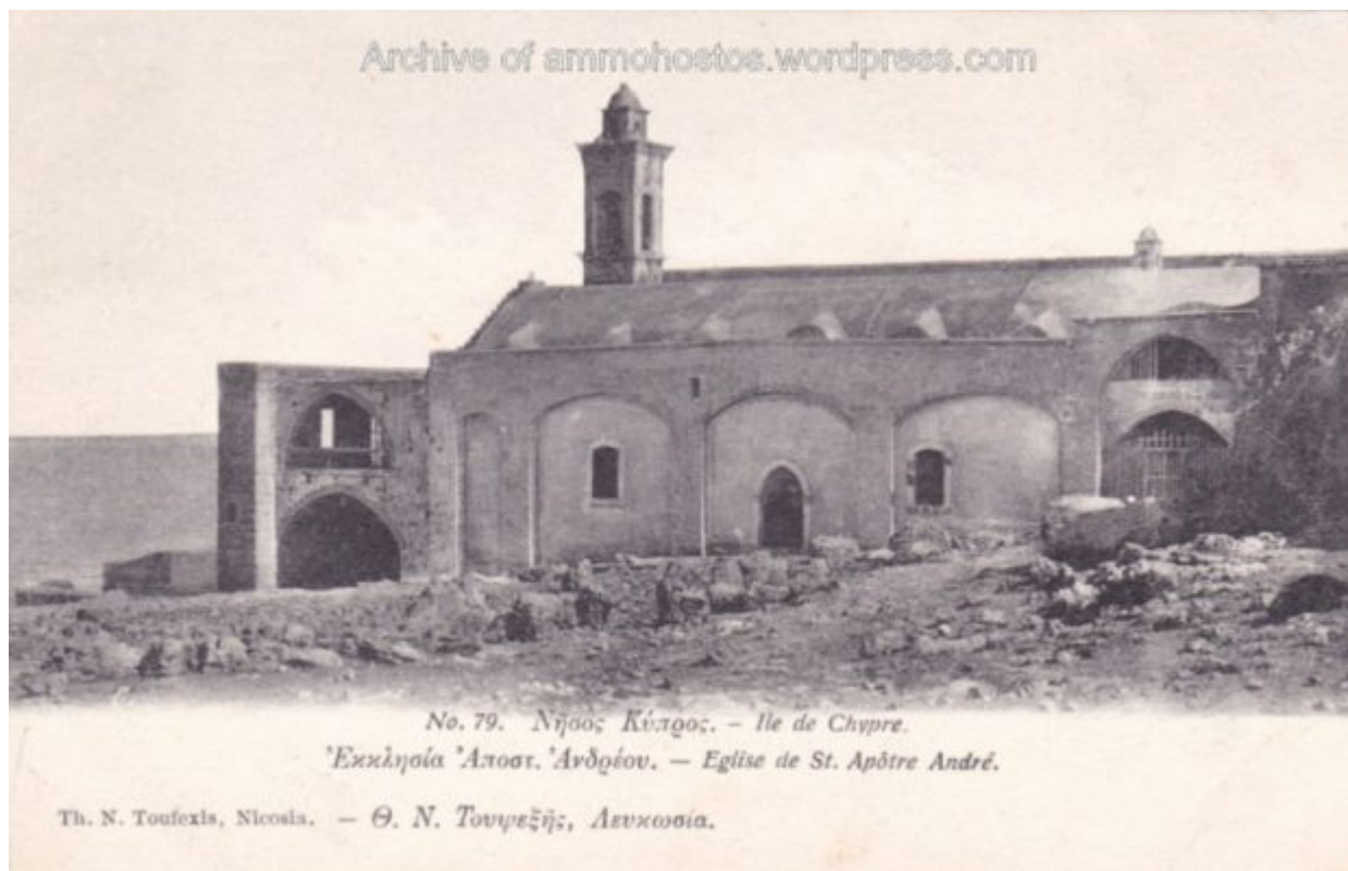
No. 79. Νησός Κύπρος. – Ile de Chypre.