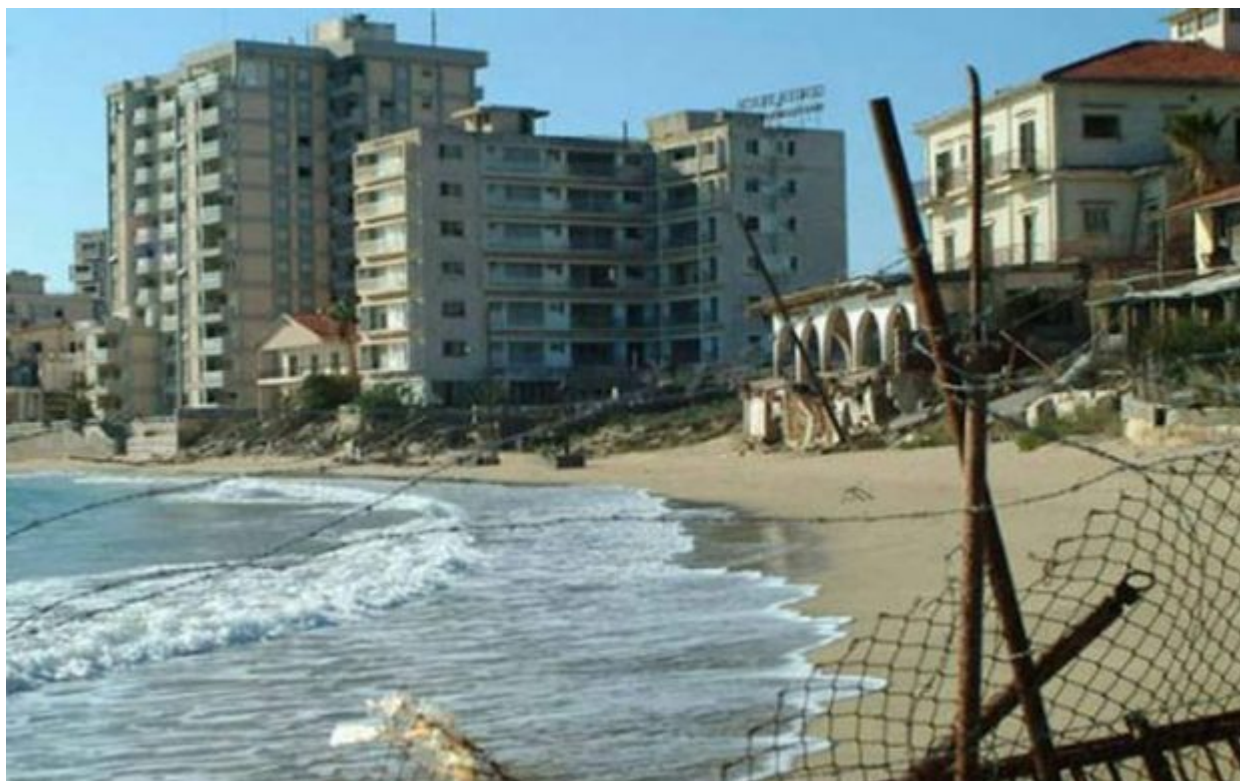
Η πόλη φάντασμα σήμερα

Η ομώνυμη συνοικία που βρίσκεται στην Έδεσσα, σύμφωνα με ιστορικά στοιχεία, είναι η πρώτη χριστιανική συνοικία που δημιουργήθηκε στην περιοχή, ως εξέλιξη του βυζαντινού οικισμού που αναπτύχθηκε στο χώρο της ακρόπολης και της αρχαίας πόλης.