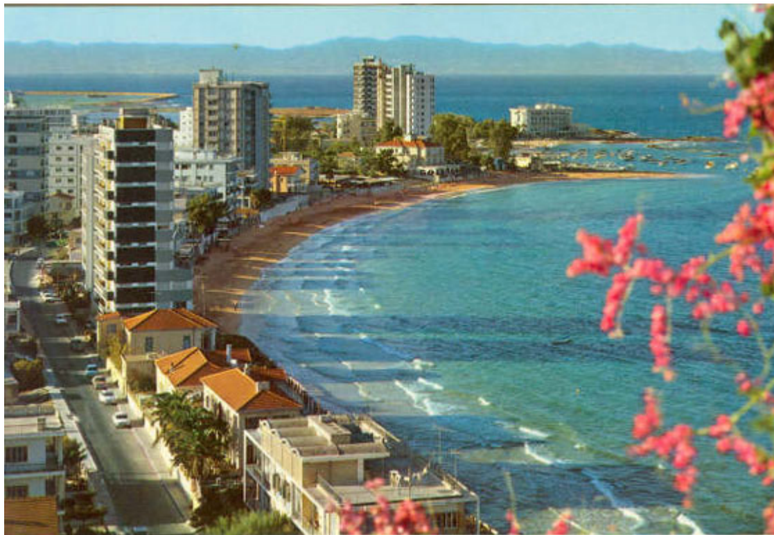
Τα Βαρώσια της Αμμοχώστου πριν από την εισβολή του 1974

Τα κυπριακά Βαρώσια ή το Βαρώσι, είναι στην ουσία η πόλη φάντασμα στο νότιο τμήμα της Κυπριακής πόλης της Αμμοχώστου. Πριν την Τουρκική εισβολή στην Κύπρο το 1974, ήταν η σύγχρονη τουριστική περιοχή της Αμμοχώστου. Οι κάτοικοί της έφυγαν κατά την εισβολή και τέθηκε υπό τουρκικό έλεγχο και παρέμεινε εγκατελειμένη υπό την κατοχή των Τουρκικών Ενόπλων Δυνάμεων από τότε. Η είσοδος απαγορεύεται για το κοινό.