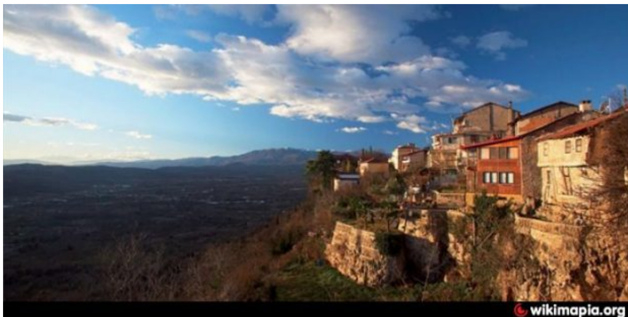
Η συνοικία όπως είναι σήμερα

Πρόσφατα έχει γίνει αποκατάσταση βαροσιώτικων σπιτιών η οποία στηρίχθηκε στην μελέτη ανάπλασης του Βαροσίου. Να σημειωθεί ότι η συγκεκριμένη μελέτη πήρε το 1ο βραβείο από την ΕΕ το 1990.