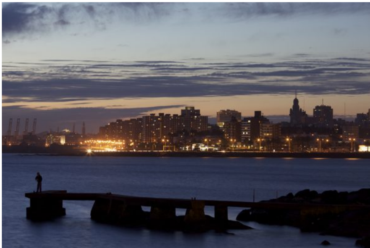
Η πρωτεύουσα της Ουρουγουάης, Μοντεβιδέο.