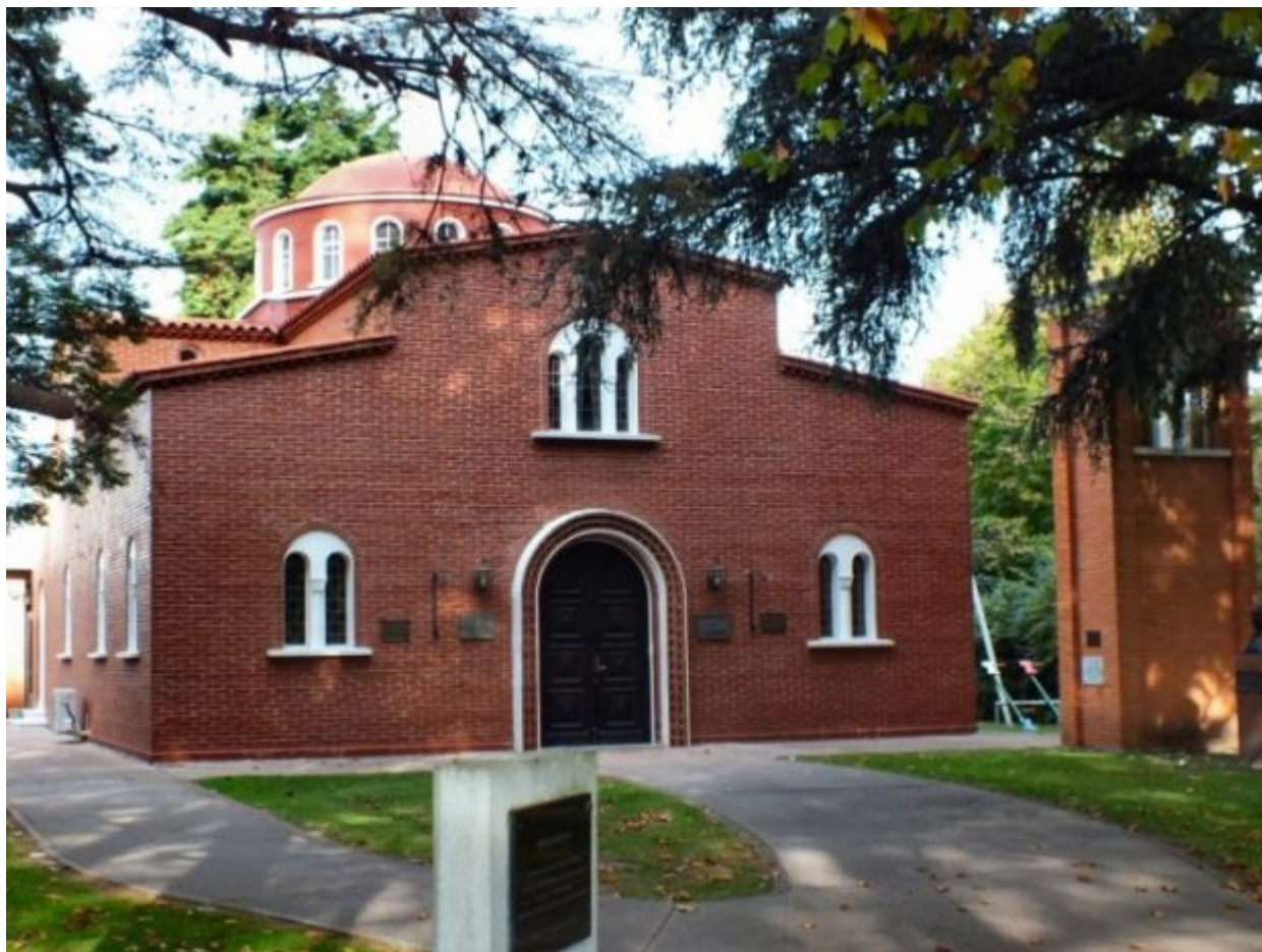
Ελληνική Ορθόδοξη εκκλησία στην Ουρουγουάη.