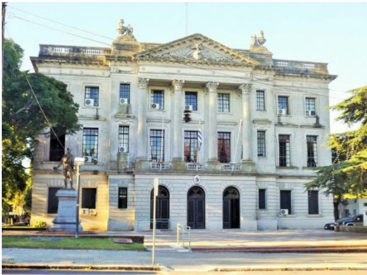
Νεοκλασικό στην Ουρουγουάη που δανείζεται στοιχείο από αρχαιοελληνικό αρχιτεκτονικό ρυθμό.

Στο Μοντεβιδέο, επίσης, υπάρχουν 23 δρόμοι που έχουν δανειστεί τα ονόματά τους από αρχαίους φιλόσοφους, ενώ ο κεντρικότερος δρόμος ονομάζεται κι αυτός «Grecia». Δύο πλατείες της πρωτεύουσας έχουν ονομαστεί πλατεία της Αθήνας και πλατεία της Ελλάδας. Την Εθνική Βιβλιοθήκη του Μοντεβιδέο, που έχει κατασκευαστεί σύμφωνα με τον αρχαιοελληνικό δωρικό αρχιτεκτονικό ρυθμό, κοσμεί έξω από την είσοδο του κτιρίου, το άγαλμα του Σωκράτη. Ένα νεοκλασικό κτίριο στην πρόσοψή του γράφει «Αθηναίος». Ταυτόχρονα, σε ένα πάρκο που επίσης ονομάζεται Αθήνα και βρίσκεται παραλιακά της πρωτεύουσας υπάρχει μια προτομή του Ομήρου.