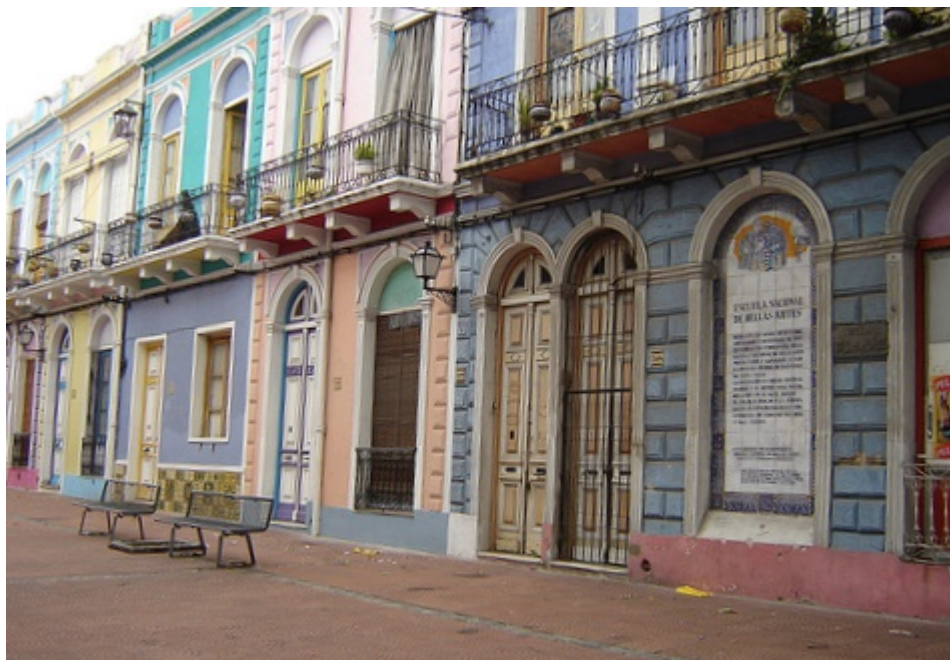
23 δρόμοι στην πρωτεύουσα της χώρας έχουν ελληνικό όνομα.