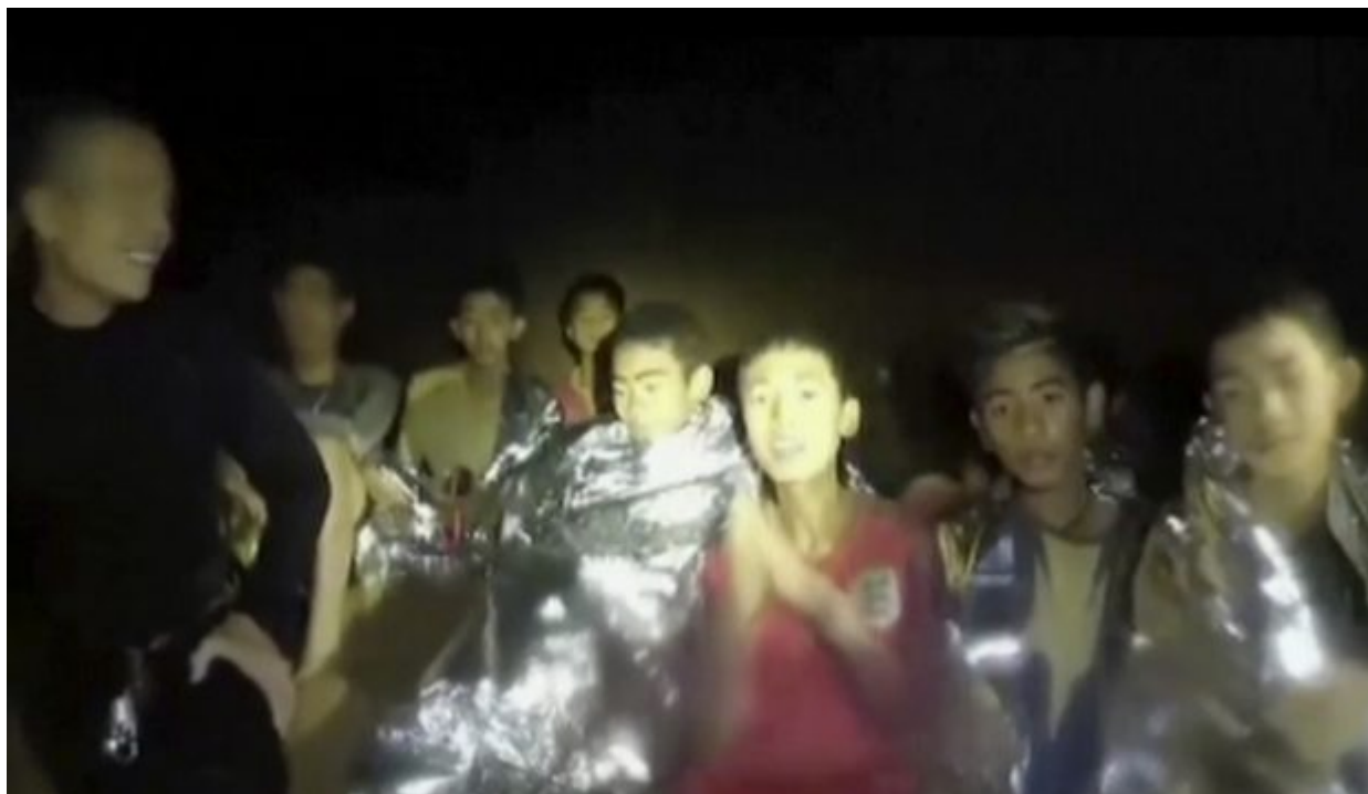
In this July 3, 2018, image taken from video provided by the Thai Navy Seal, Thai boys are with Navy SEALs inside the cave, Mae Sai, northern Thailand. With heavy rains forecast to worsen flooding in a cave in northern Thailand where 12 boys and their soccer coach are waiting to be extracted by rescuers, authorities say they might be forced to have them swim out through a narrow, underwater passage. The 13 are described as healthy and being looked after by medics inside the cave.

Οι «Αγριόχοιροι» δέχθηκαν μηνύματα αλληλεγγύης από διάσημες προσωπικότητες της διεθνούς σκηνής: από τον πρόεδρο των ΗΠΑ Ντόναλντ Τραμπ, τον αστέρα του ποδοσφαίρου Λιονέλ Μέσι και τον Αμερικανό γκουρού της τεχνολογίας Έλον Μασκ.