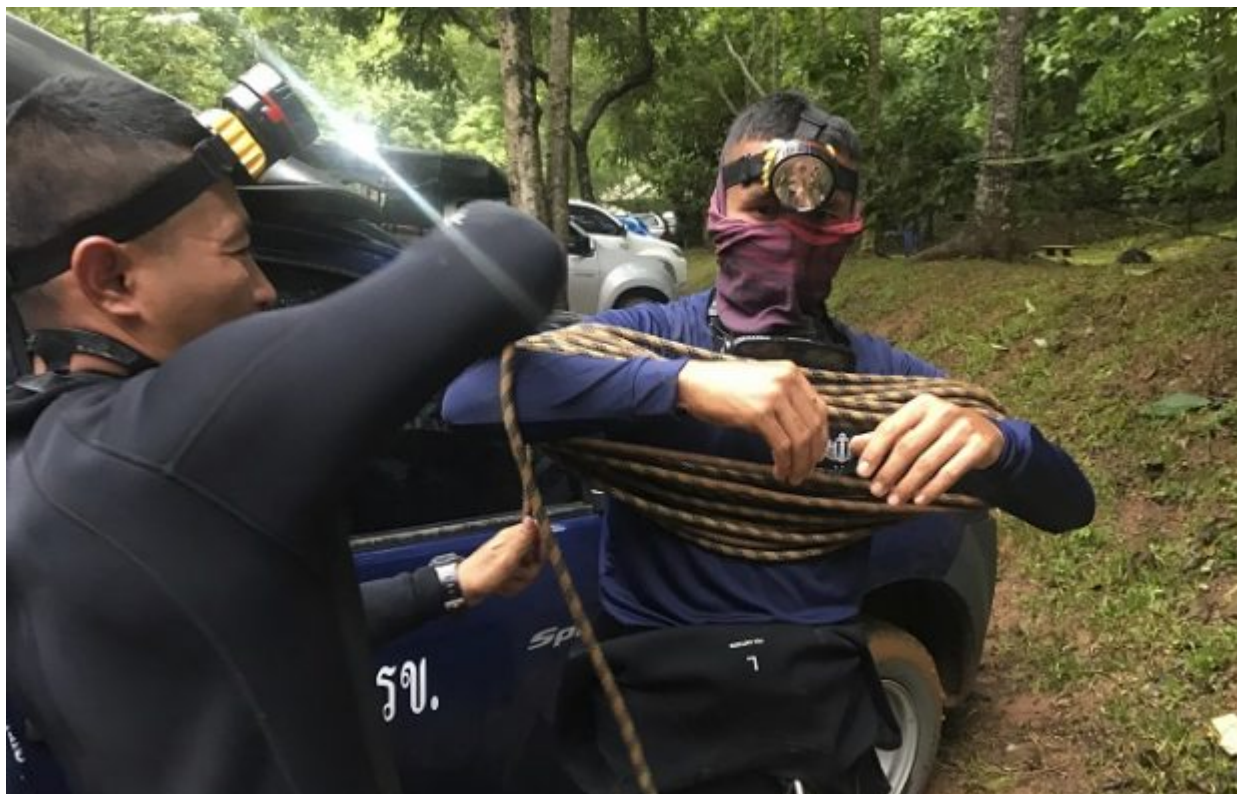
Rescue workers continue to search for a group of missing boys and their coach in a flooded cave, Tuesday, June 26, 2018, in Mae Sai, Chiang Rai province, northern Thailand. Electricians are extending a power line into a flooded cave in northern Thailand to help the search and rescue efforts for 12 boys and their soccer coach stranded three nights in the sprawling caverns and cut off by rising water.

«Δεν είμαστε βέβαιοι εάν μιλάμε για ένα θαύμα, ένα επιστημονικό επίτευγμα ή κάτι άλλο. Και οι 13 Wild Boars βγήκαν από το σπήλαιο» έγραψε η μονάδα SEAL του πολεμικού ναυτικού λεπτά μετά τη διάσωση.