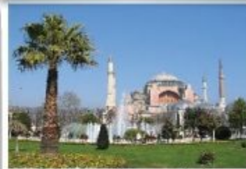
Εκδρομή στην Κωνσταντινούπολη