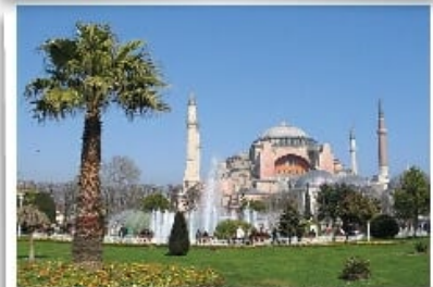
Εκδρομή στην Κωνσταντινούπολη